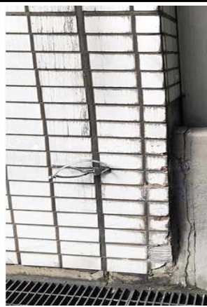
4번: 배수흡통탈락(산성방향 방음터널 연결부)