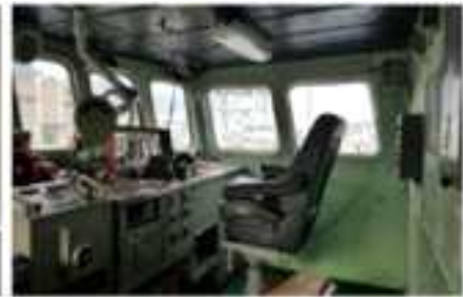
(조타실 체험, 2층)