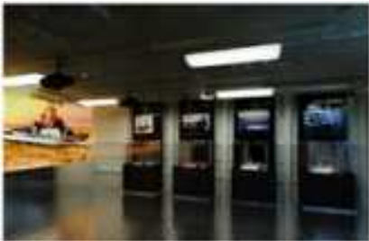
(배모형 전시, 지하1층)