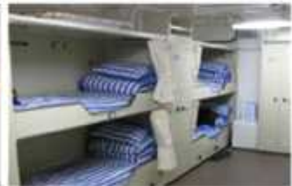
(수병 침실, 1층)