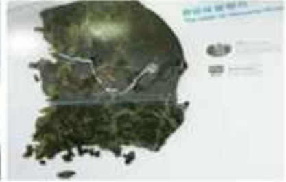
(한강 발원지, 2층)