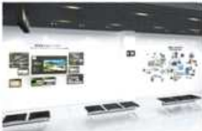
(안내센터 공원소개, 1층)