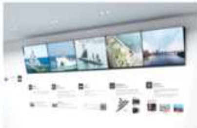
(안내센터 멀티영상, 1층)