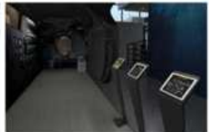
(잠수정 전시실, 1층)