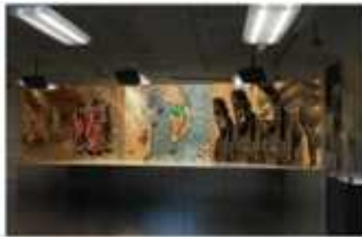
(군함 이야기, 지하1층)