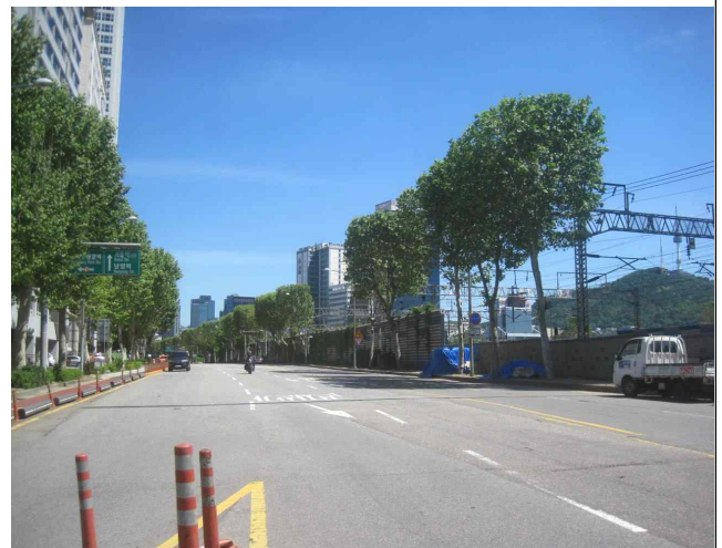
3련박스 외부 상부