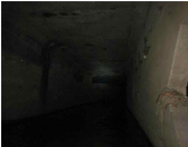
4련 박스구간 내부