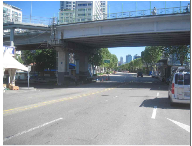
라멘구간 외부 상부