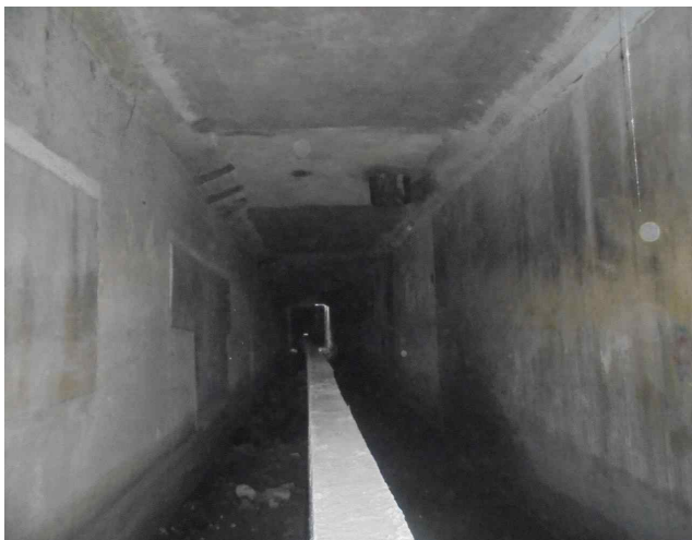
3련박스 구간 내부