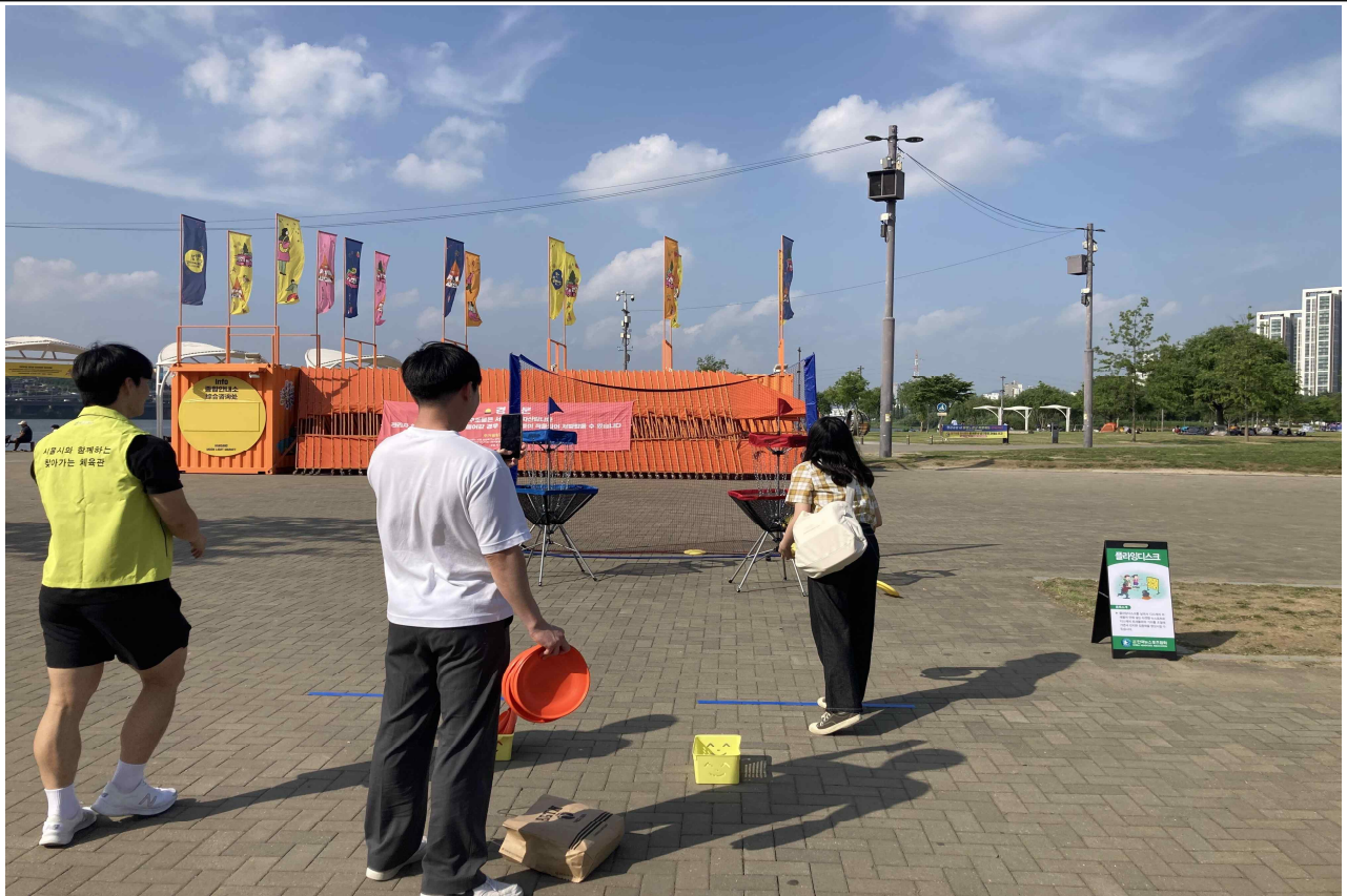
찾아가는 체육관에서 플라잉디스크를 체험하는 시민들