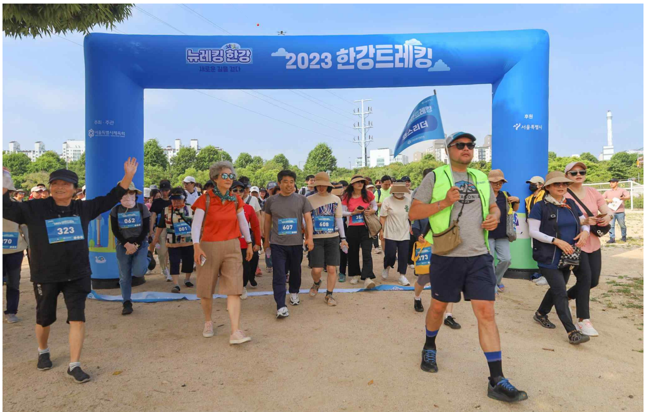
한강트레킹에 참여한 시민들