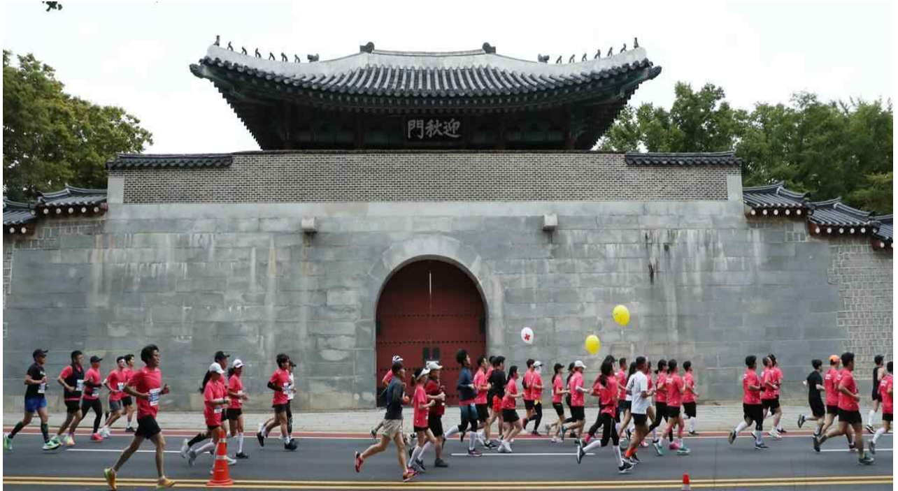
서울달리기에 참가하여 달리는 시민들