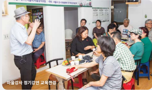
마을강사 정기강연 교육전경

주제 : 조직관리, 갈등관리, 회계관리, 공모사업 등 시간 : 1차에 2강좌, 강좌별 1시간(16:00~18:00) 강사 : 제1기 마을강사모임(정회원)에서 추천받은 마을강사 장소 : 권역별 관리형 주거환경개선사업 공동이용시설 (서남권, 강북권, 중부권, 남동권, 강동권, 서북권)