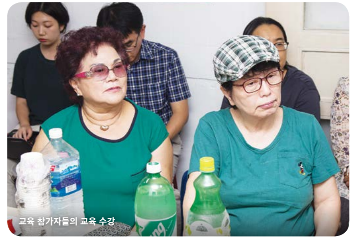
교육 참가자들의 교육 수강

“실무적으로 궁금한 것을 물어볼 곳이 없었는데, 오늘 강의가 많이 도움이 되었습니다. 미뤘던 일을 바로 처리할 수 있을 것 같습니다.”