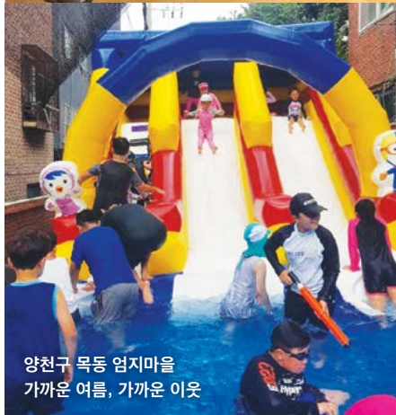
양천구 목동 엄지마을 가까운 여름, 가까운 이웃