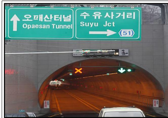
☞ 화계사길 방향