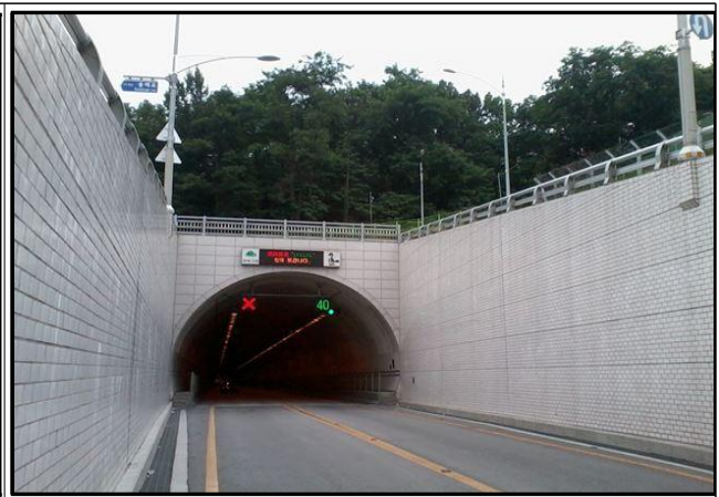
☞ 보승사 방향