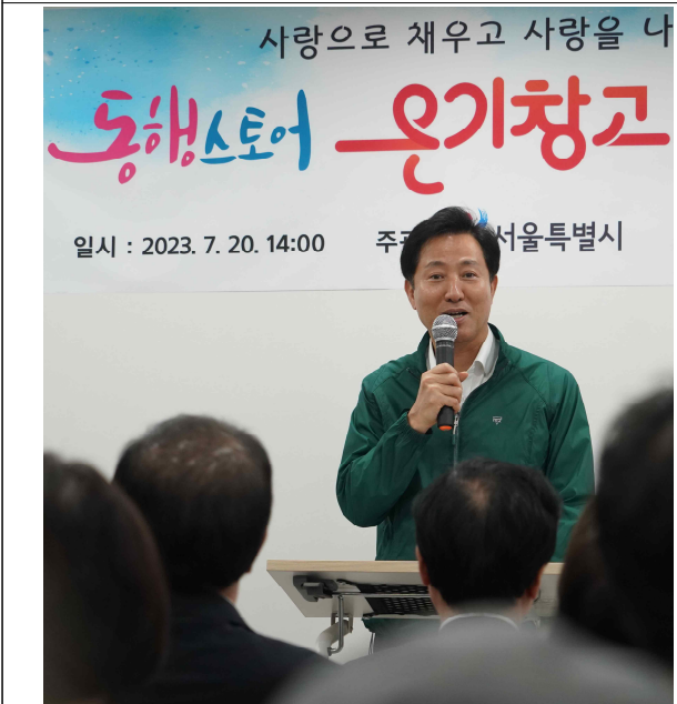
서울역 온기창고(1호점) 개소식