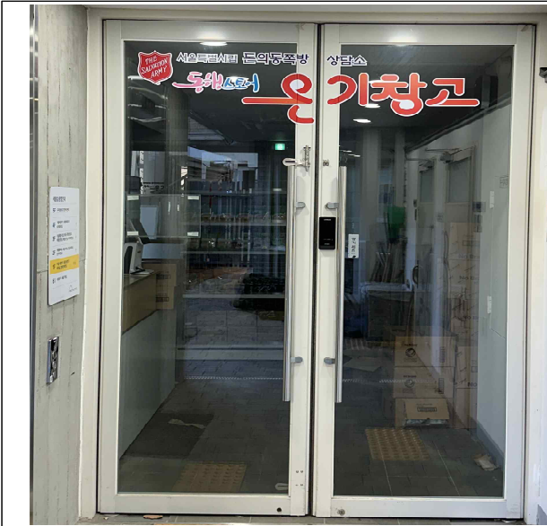
돈의동 온기창고(2호점) 현관입구