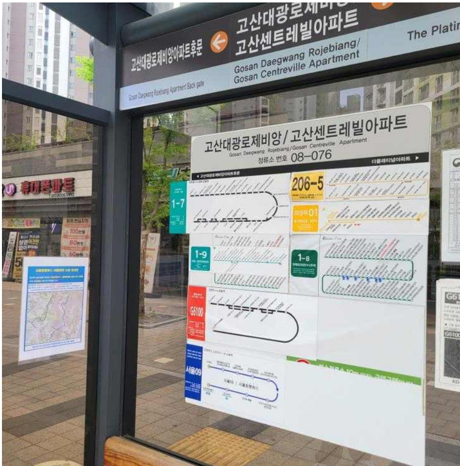
서울09번 노선의 운행 안내를 위해 노선도 부착이 완료된 의정부 고산지구 버스정류소