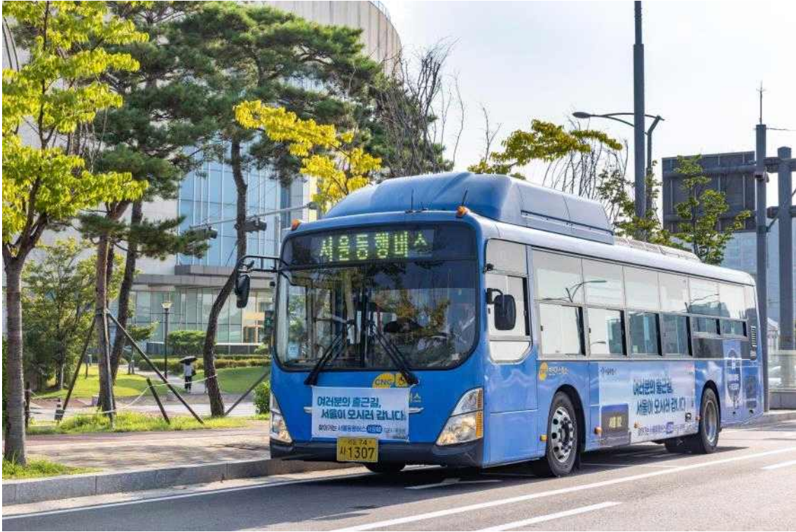
운행 중인 서울동행버스 사진 (사진은 서울02번)