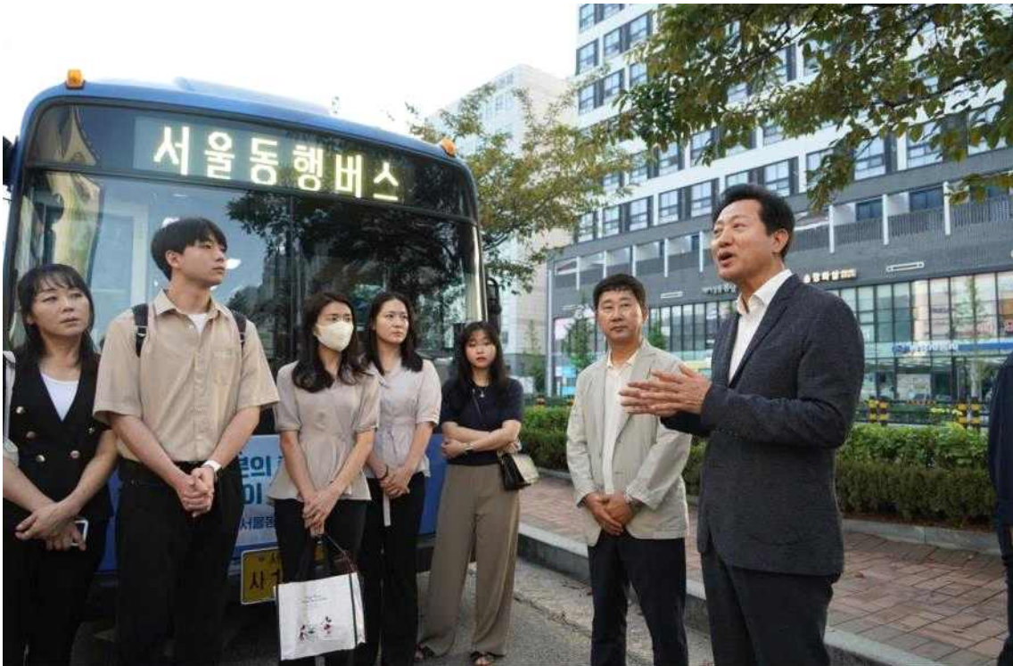
오세훈 서울시장이 23. 8.17일(목) 오전 김포시 풍무동에서 출발하는 서울동행버스 02번 시승에 앞서 시민들에게 서울동행버스의 취지에 대해 설명하고 있다.