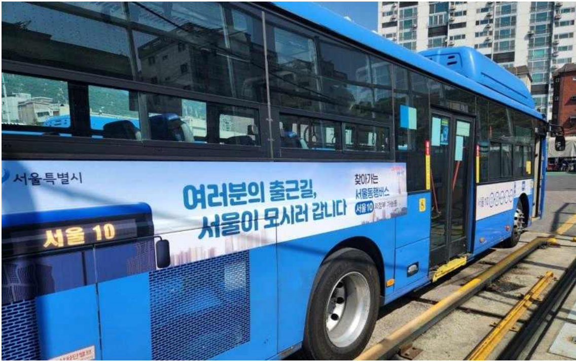
의정부시 가능동~도봉산역 구간을 운행하는 서울10번 버스의 모습