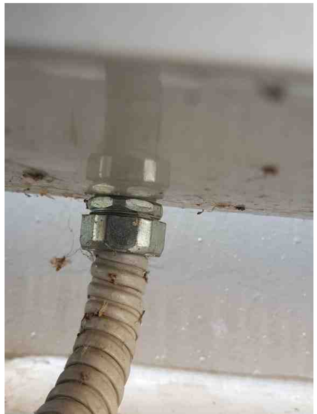
전선관 시공 양호