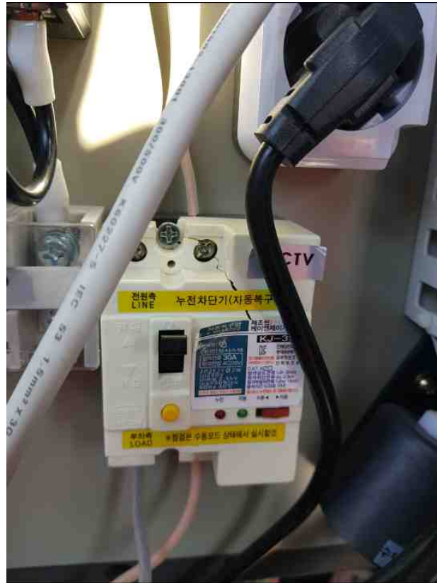
분전반내 누전차단기 파손