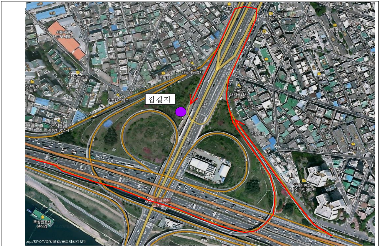
영동대교 북단 접속교 하부 ( 영동대교 보수공사 현장사무실)