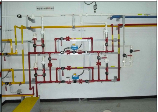
- 안전밸브 재설치 후