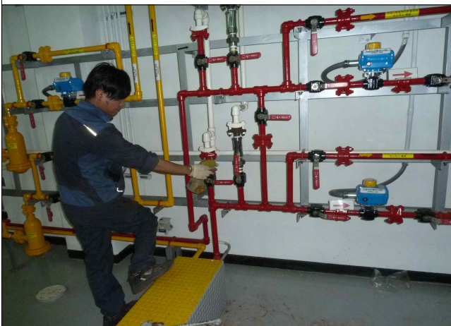
- 누설점검 (암모니아수용액)