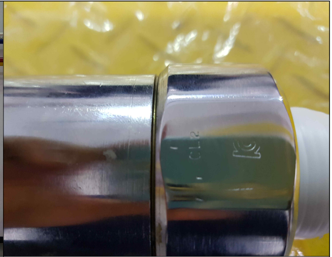
- 스프링식 안전밸브(4EA) 검수