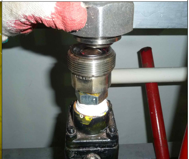
- 파열판식 안전밸브 설치