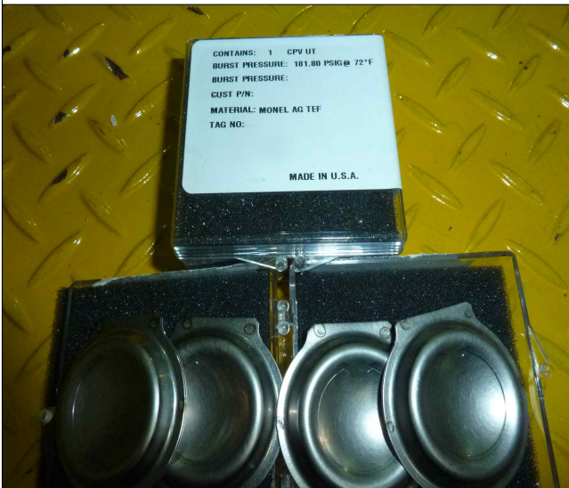
- 파열판식 안전밸브(4EA) 검수