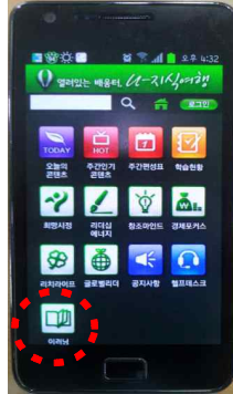
③로그인후 '이러닝' 터치