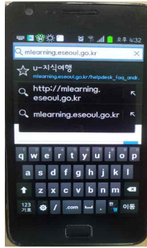
② 주소 입력