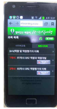
④e/u 검용과정 학습