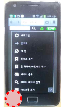
⑤(기기의 설정버튼) 북마크 및 홈화면 바로가기 추가