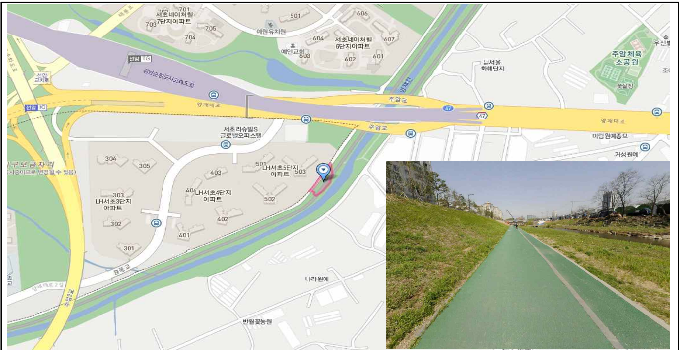
양재천 보상(서초구 우면동 361-1)