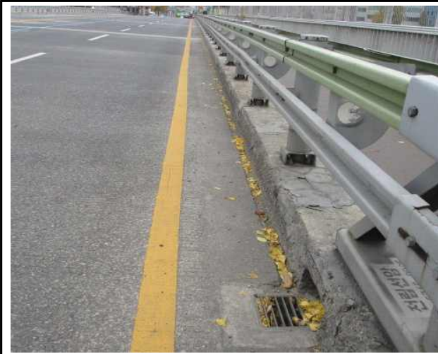
1 : 중랑교 배수로 낙엽 등