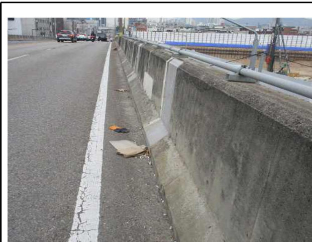
2 : 영동대교북단고가차도 쓰레기 등