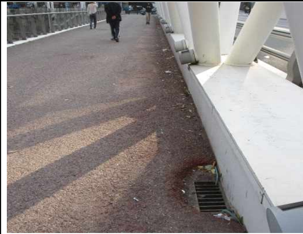
4 : 무학교 빗물받이 쓰레기