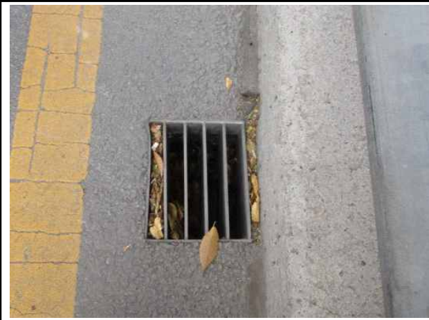
1 : 고산자교 빗물받이 퇴적물