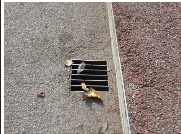
2 : 정릉천교 빗물받이 퇴적물