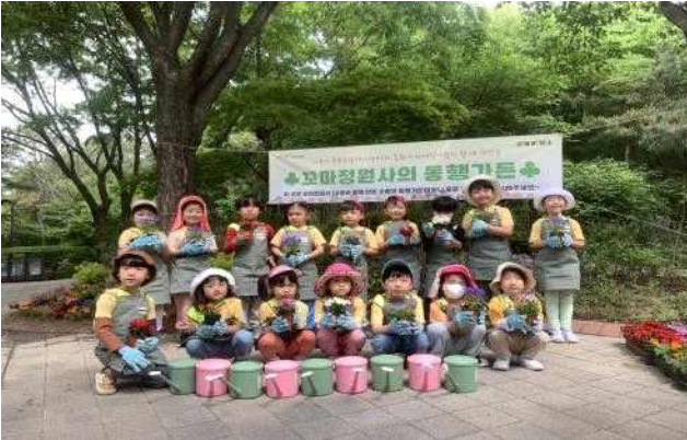
중부 남산(정원친구들과 함께 노는 “동행가든”)