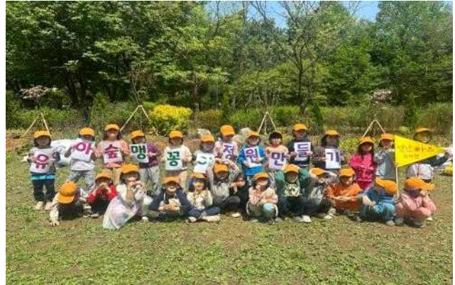
서부 월드컵공원(어린이와 함께만든 맹공이정원)