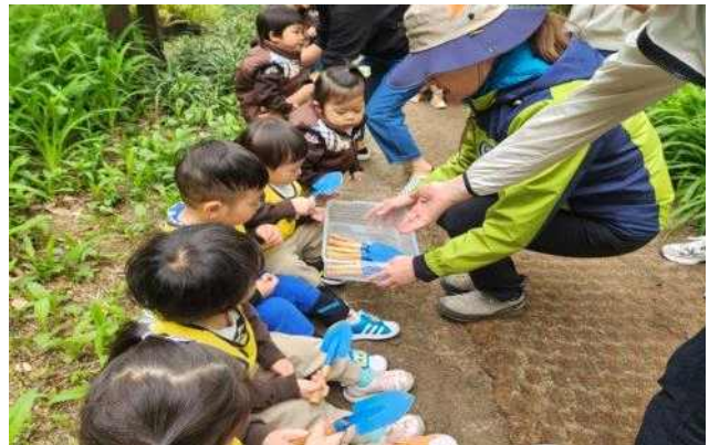
강북구 북한산(WELCOME GROVE)