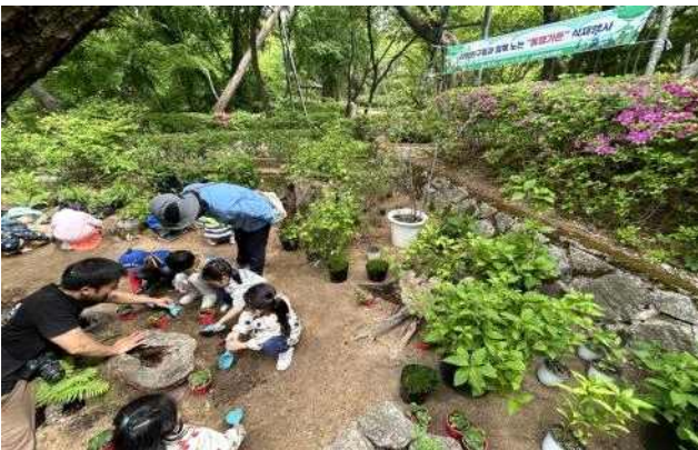
종로구 삼청공원(“누구의 집일까” 동행가든)