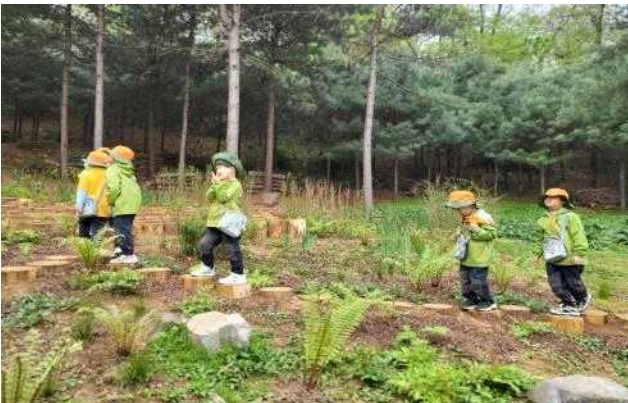
양천구 신정산 우렁바위(감각의 정원)