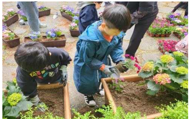
용산구 매봉산 응봉공원(소풍 정원)