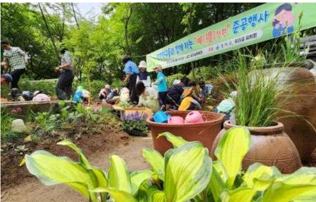
강서구 궁산(궁산 禮정원 동행가든)