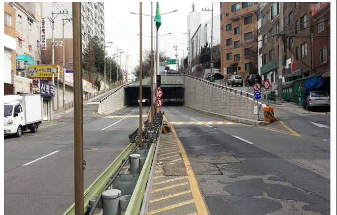
신길지하차도 전경 (신길동 방향)-방음터널설치요청지