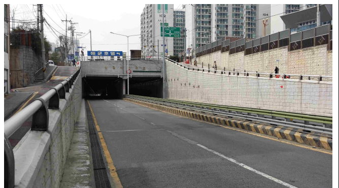
방호난간 1단지주 파손 교체요청지(대방동방향)