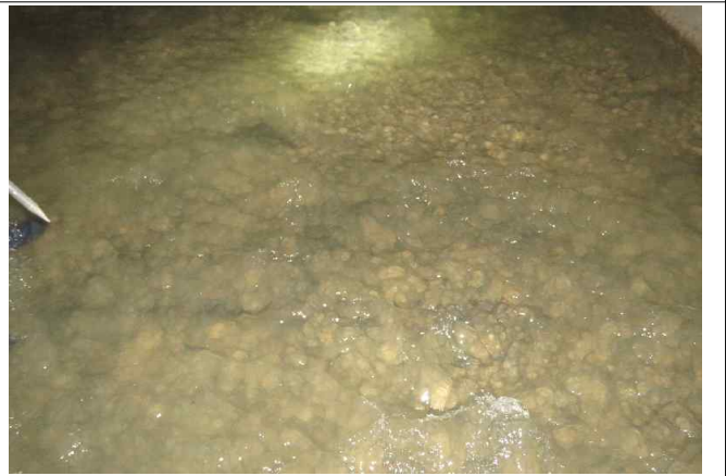
(시흥천1복개) 3런 BOX구간 바닥부 표면 침식