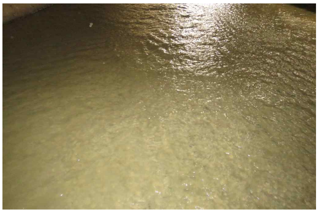
(시흥천2복개) 바닥면 침식