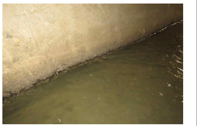
(시흥천2복개) 우측옹벽 침식