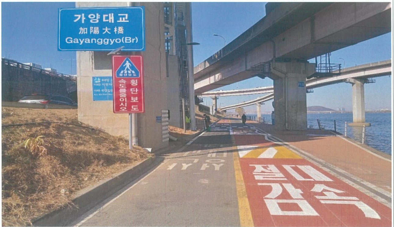
(가양대교 남단 승강기 하부 측 자전거도로)