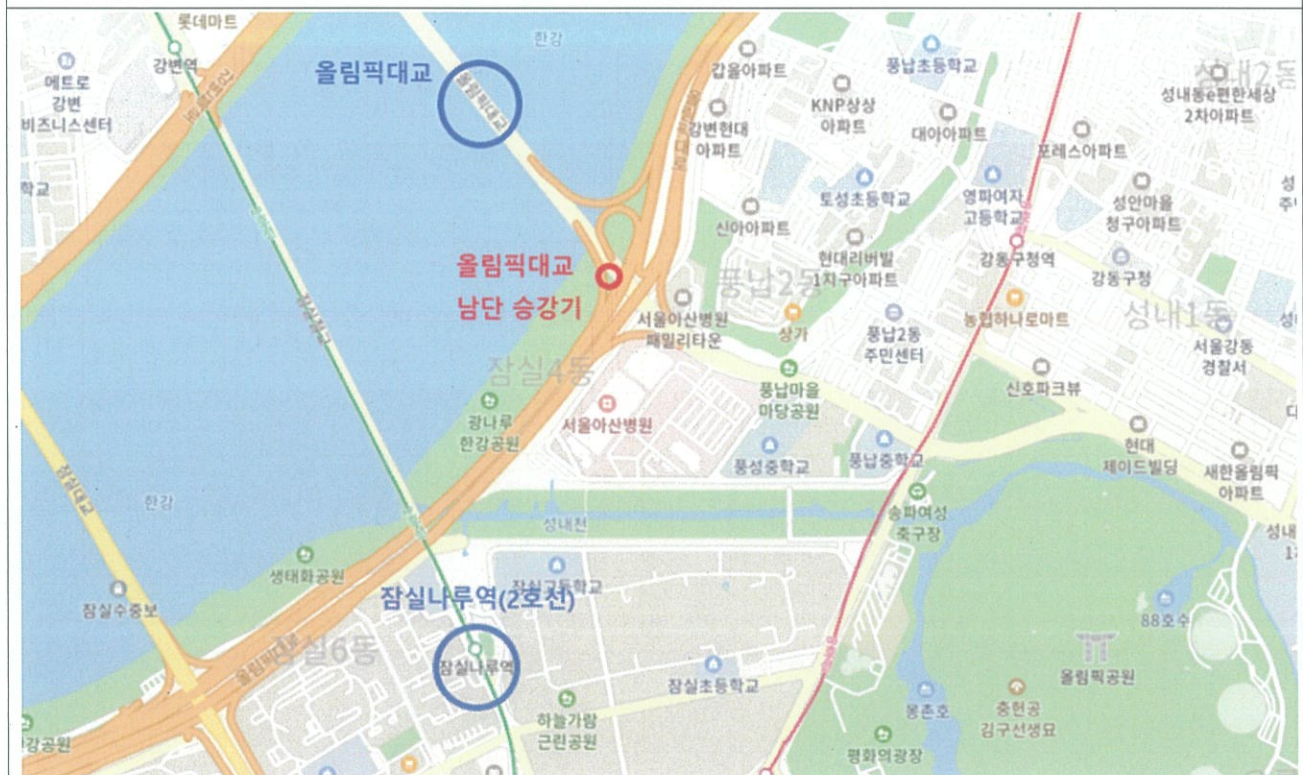
(올림픽대교 남단 승강기)