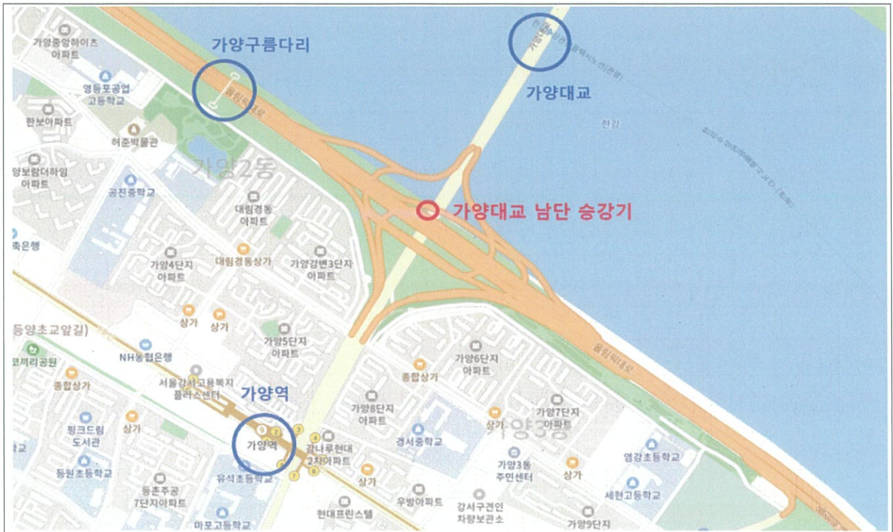
(가양대교 남단 승강기)