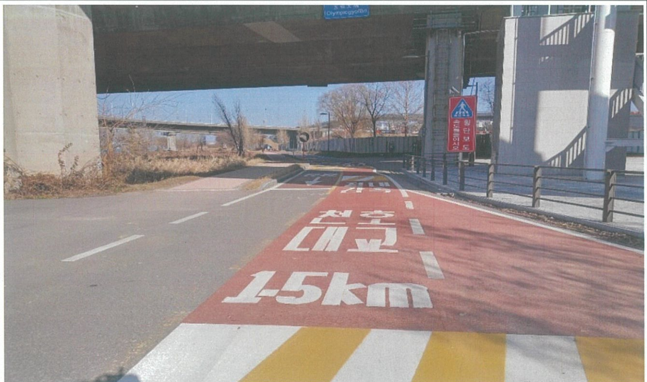
(올림픽대교 남단 승강기 하부 측 자전거도로)