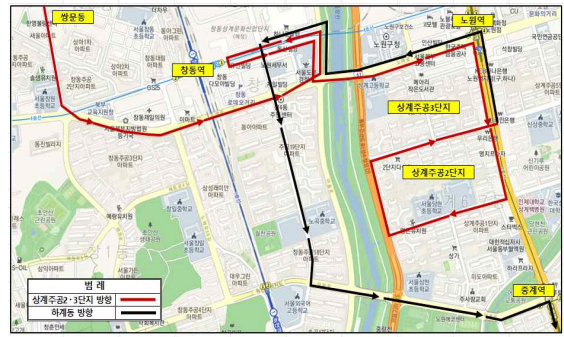
회차지→차고지 방면 운행시