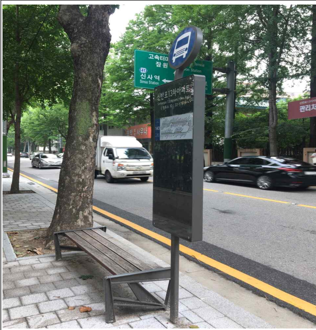
신반포13차아파트[22-179] 정류소 현장사진