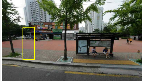
목동14단지상가[15175] 원위치 이전 장소 현장사진