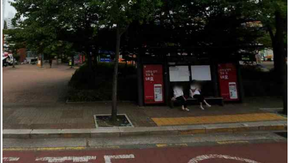
목동14단지관리사무소앞[15191] 원위치 이전 장소 현장사진

※ 목동14단지상가[15-175]와 목동14단지관리사무소[15-191]사이 횡단보도에 신호등 신설예정 (강서도로사업소 기전과(정경성, 02-2657-7969)에서 2018.7.13.부터 공사 시행)