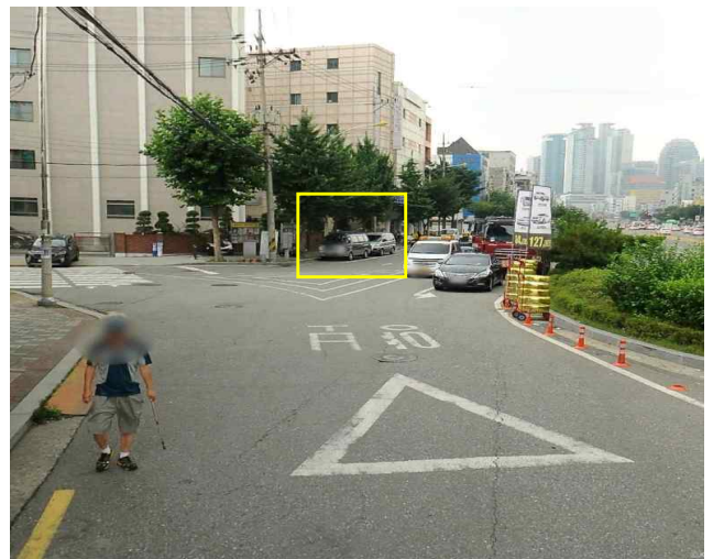
[21-371]정류소 이전 대상지 (정류소 이전 승인 취소)