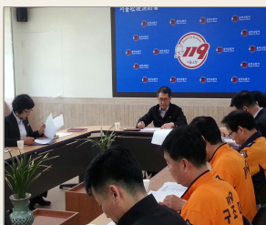
기념행사 TF팀 운영