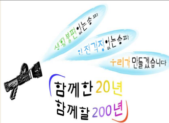
개서 20주년 슬로건