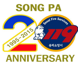
개서 20주년 기념 로고