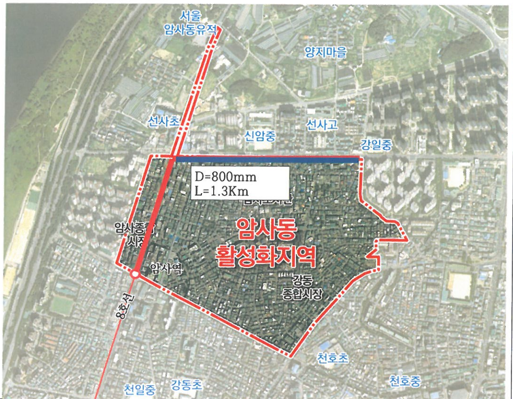
위치도 및 공사현황도 (부분별,공구별)