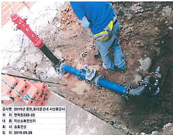
공사명 2019년 중랑, 동대문구내 시설물공사 위 치 면목동233-23 내 용 지상소화전설치 회 사 승효건설 일 지 2019.09.28