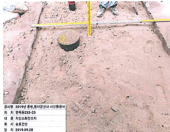
공사명 2019년 중랑, 동대문구내 시설물공사 위 치 면목동233-23 내 용 지상소화전설치 회 사 승효건설 일 지 2019.09.28