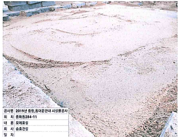
공시명 2019년 중랑, 동대문구 관내 시설물공사 위 치 중화동284-11 내 용 모래포설 회 사 승효건설 일 자