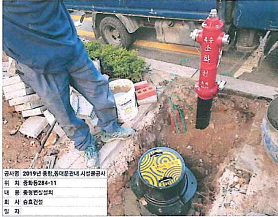
공시명 2019년 중랑, 동대문구 관내 시설물공사 위 치 중화동284-11 내 용 중형변실설치 회 사 승효건설 일 자

□ 작업지시번호 : 소방-102 □ 위 치 랑구 동일로 820-1(중화동 284-.