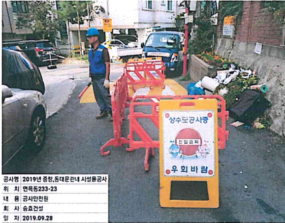
공사명 2019년 중랑, 동대문구내 시설물공사 위 치 면목동233-23 내 용 공사안전원 회 사 승효건설 일 지 2019.09.28