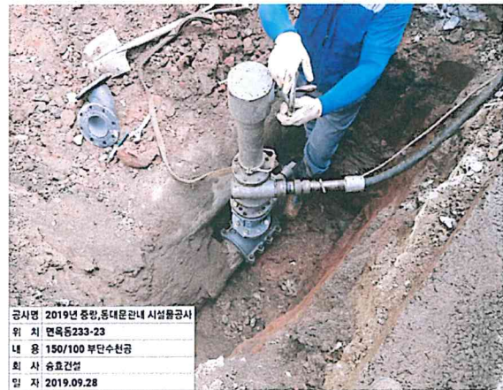
공사명 2019년 중랑, 동대문구내 시설물공사 위 치 면목동233-23 내 용 150/100 부단수원공 회 사 승효건설 일 지 2019.09.28