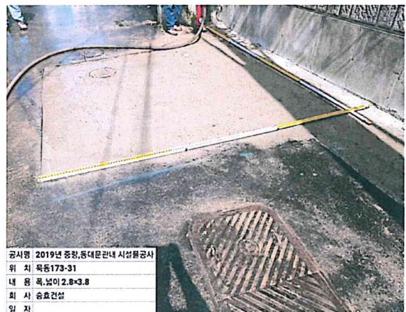
공사명 2019년 중랑, 동대문관내 시설물공사 위 치 목동173-31 내 용 폭, 넓이 2.8×3.8 회 사 승효건설 일 자