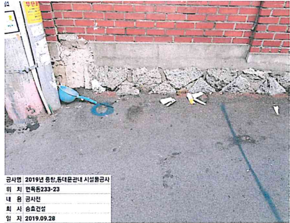
공사명 2019년 중랑, 동대문구내 시설물공사 위 치 면목동233-23 내 용 공사원 회 사 승효건설 일 지 2019.09.28