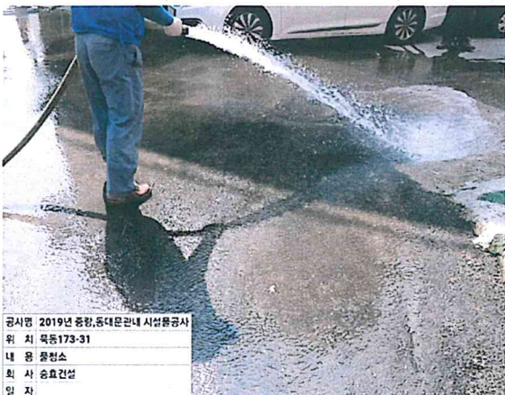
공사명 2019년 중랑, 동대문관내 시설물공사 위 치 목동173-31 내 용 물청소 회 사 승효건설 일 자