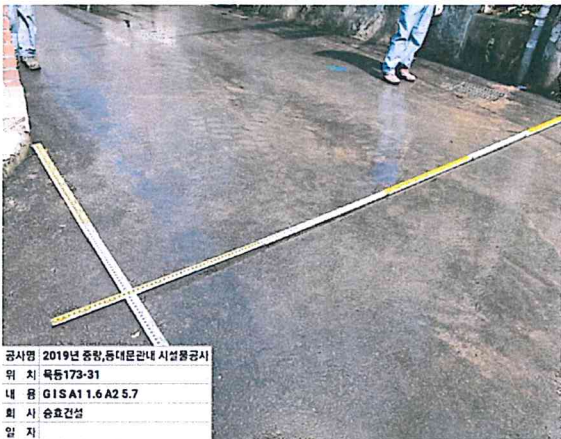
공사명 2019년 중랑, 동대문관내 시설물공사 위 치 목동173-31 내 용 GIS A1 1.6 A2 5.7 회 사 승효건설 일 자