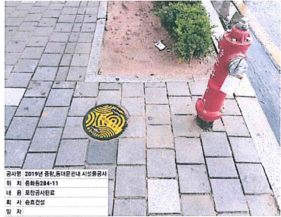
공시명 2019년 중랑, 동대문구 관내 시설물공사 위 치 중화동284-11 내 용 포장공사완료 회 사 승효건설 일 자