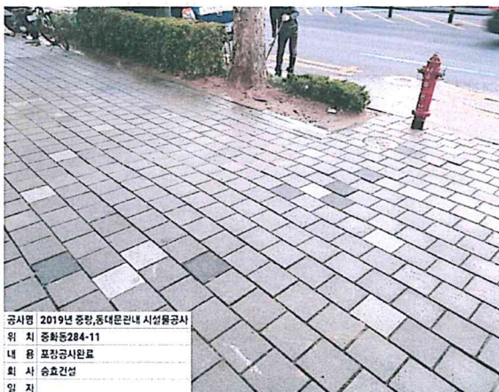
공시명 2019년 중랑, 동대문구 관내 시설물공사 위 치 중화동284-11 내 용 포장공사완료 회 사 승효건설 일 자