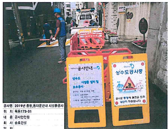
공사명 2019년 중랑, 동대문관내 시설물공사 위 치 목동173-31 내 용 공사안전판 회 사 승효건설 일 자