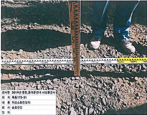
공사명 2019년 중랑, 동대문관내 시설물공사 위 치 목동173-31 내 용 지상소화관설치 회 사 승효건설 일 자