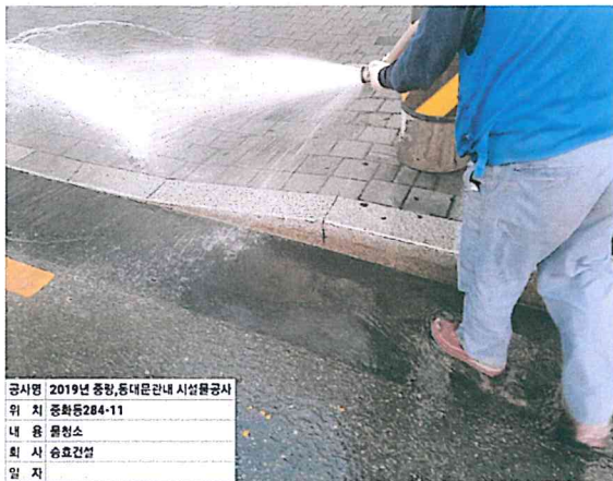
공시명 2019년 중랑, 동대문구 관내 시설물공사 위 치 중화동284-11 내 용 물청소 회 사 승효건설 일 자