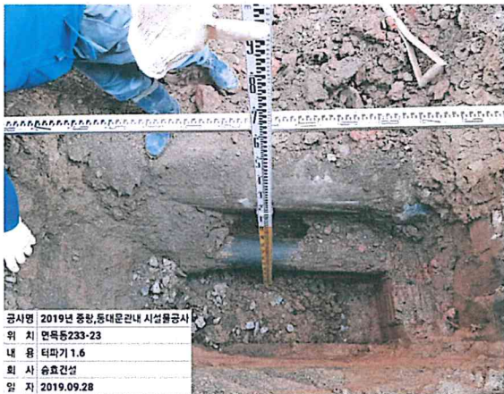
공사명 2019년 중랑, 동대문구내 시설물공사 위 치 면목동233-23 내 용 터파기 1.6 회 사 승효건설 일 지 2019.09.28