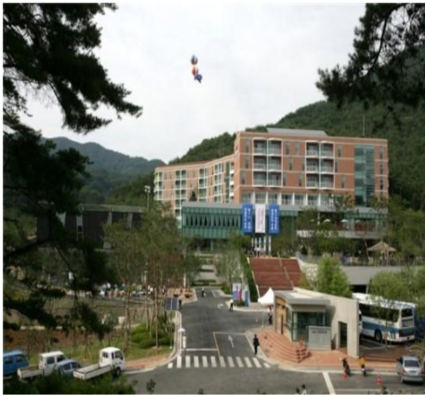
수안보 연수원 전경