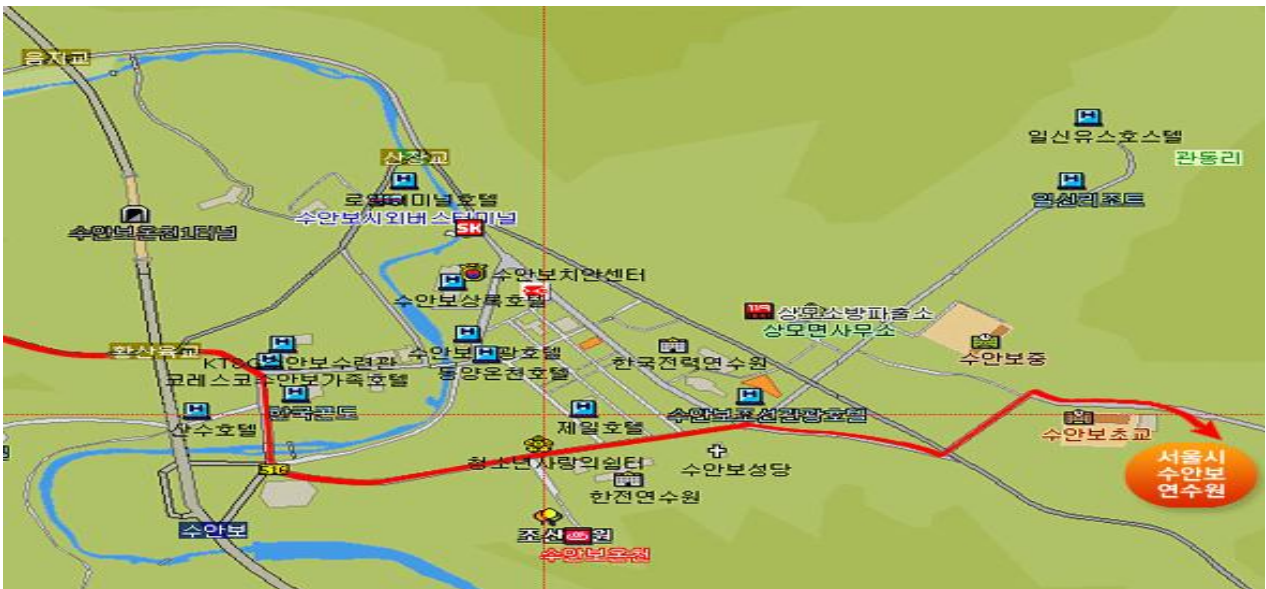
서울시수안보 연수원 위치도