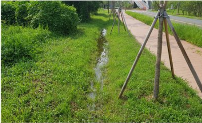
- 자연정화 잔디수로 -