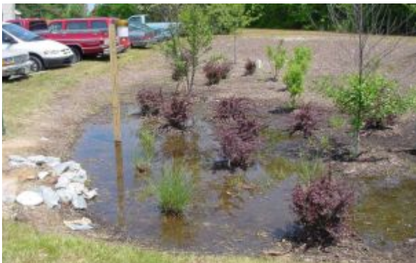
- 조성사례 -