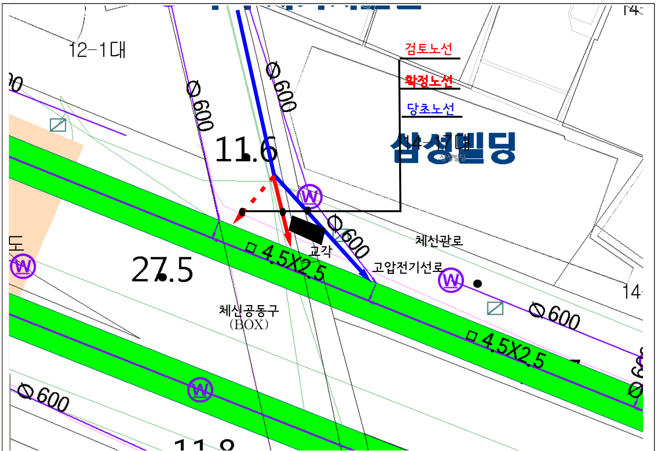
[뚝섬역 3~4번출구 지장물도]