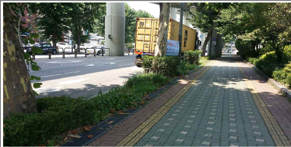
플라타너스 9주 정비 및 띠녹지 이식(사철나무, 맥문동, 비비추)