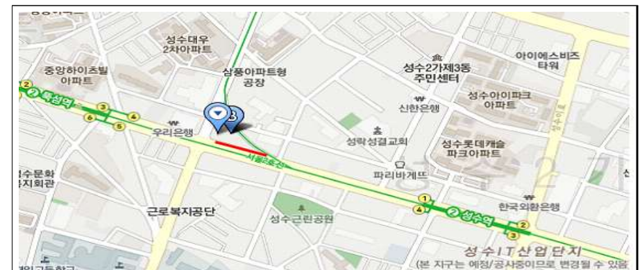
2호선 신설동 구간 지선하부(L = 120M, B = 4.5M)