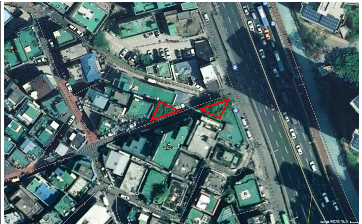
개봉동 68-87 등 22개소