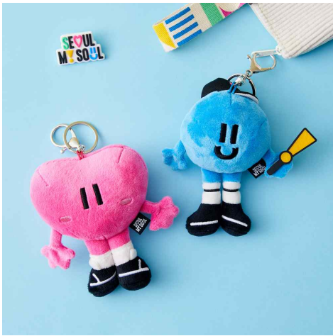
동행이 매력이 열쇠고리