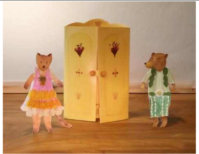
전시 연계 프로그램 '나는야 숲속 디자이너'