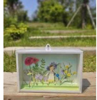
<전시 연계 프로그램>