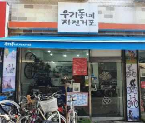
〈사진 4〉 혁신시책 부문 최우수상 ‘방치자전거 재생 활성화’