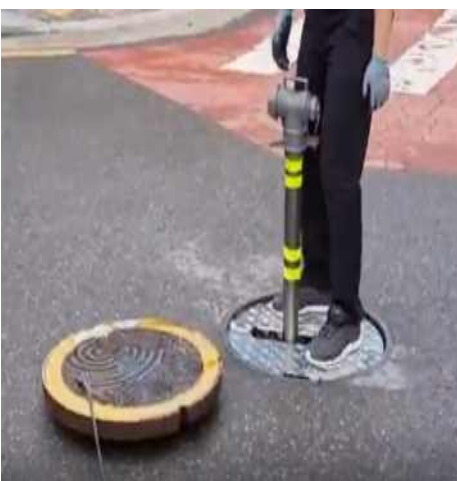
〈사진 3〉 제안실행 부문 최우수상 ‘소화전 맨홀 빠짐사고 방지를 위한 안전덮개 설치’