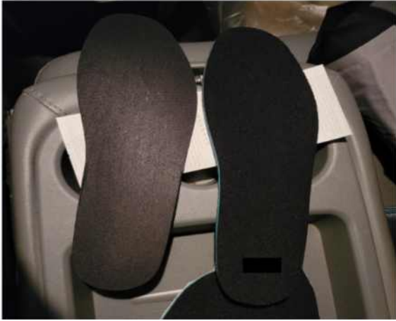
〈사진 2〉 창의제안 공무원 부문 최우수상 ‘방화신발 관통 사고 예방을 위한 방안 제안’