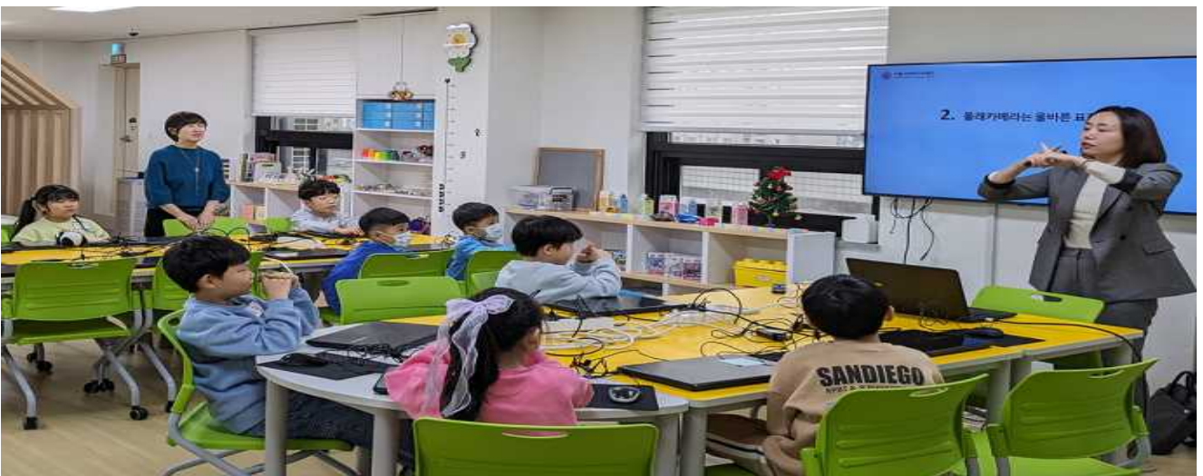
디지털 윤리 코딩 강사 양성 과정 수료생 출강 사진