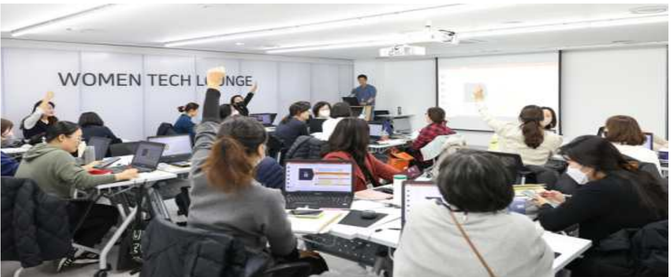
IT 프리랜서 양성 과정