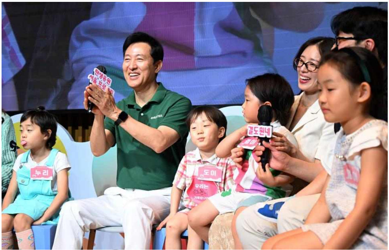
서울 다둥이 가족과의 대화