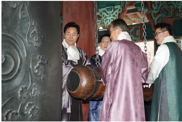
제104주년 3.1절 기념 타종행사(타종)