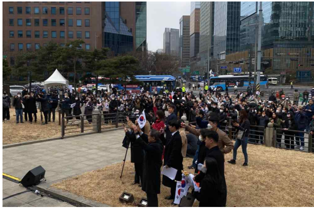
제104주년 3.1절 기념 타종행사(행사장)