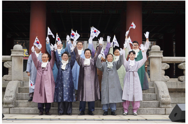
제104주년 3.1절 기념 타종행사(기념촬영)