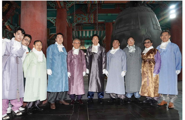
제104주년 3.1절 기념 타종행사(타종인사)