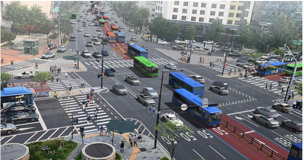
〈서대문역교차로 (공사 후)〉