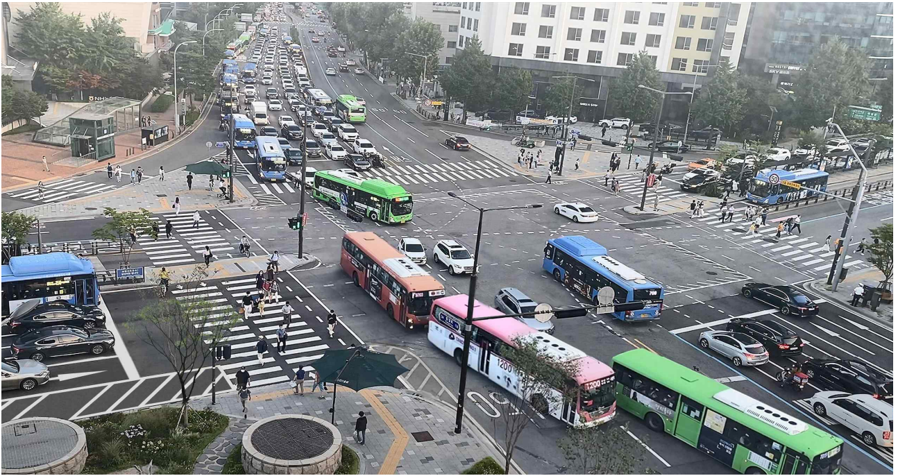
〈서대문역교차로 (공사 전)〉