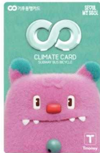
기후동행카드 신규 디자인 (7월~)