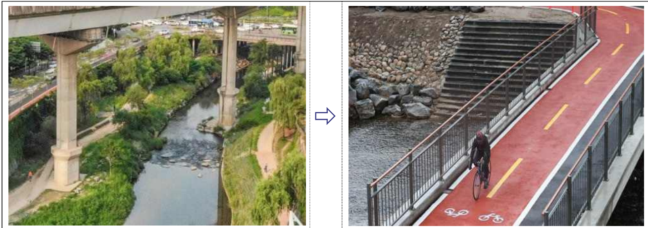
'보행·자전거 전용교' 교량 신설구간 30m(정릉천·청계천 합류부)