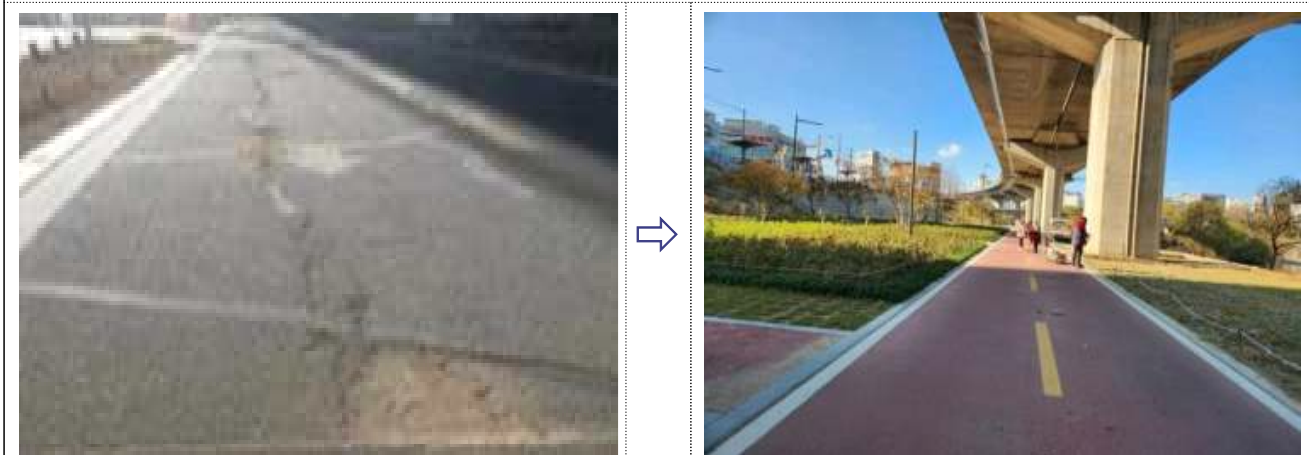
노후 자전거도로 정비구간 1,140m(신답철교~중랑천 합류부)