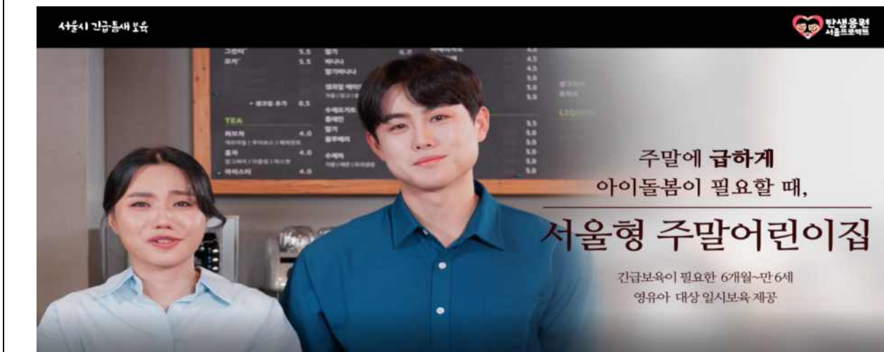
주말근로자 위한 긴급 돌봄서비스