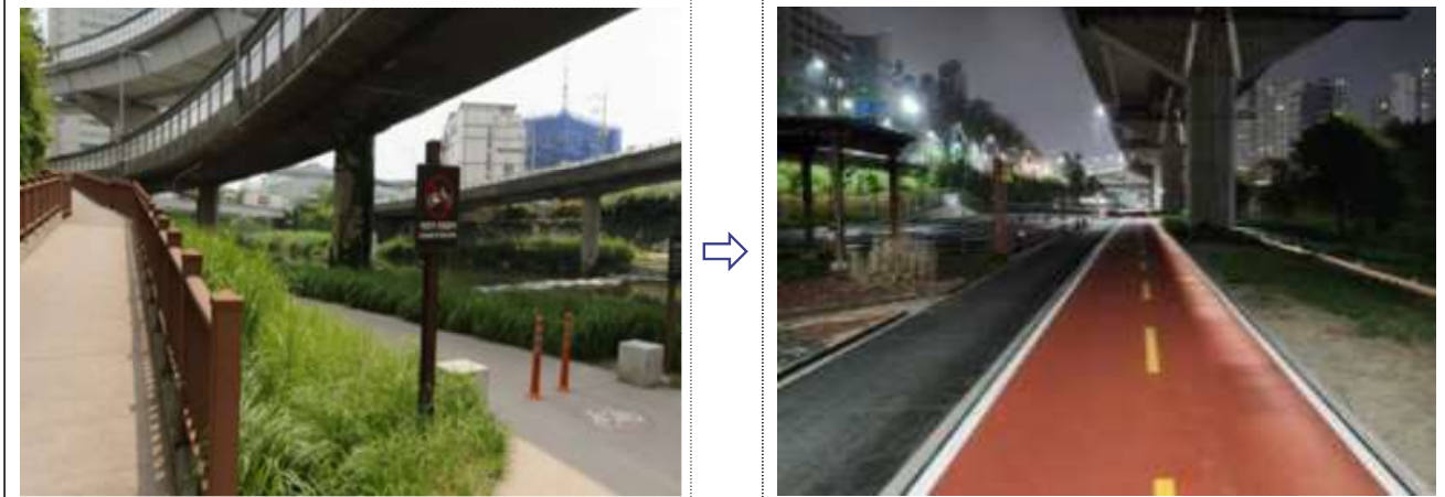
자전거도로 신설구간 485m(정릉천~청계천~신답철교)