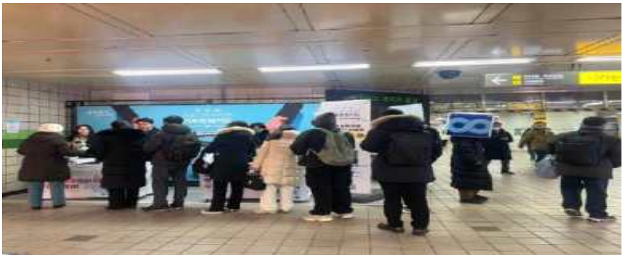
기후동행카드 구매자 대기 행렬