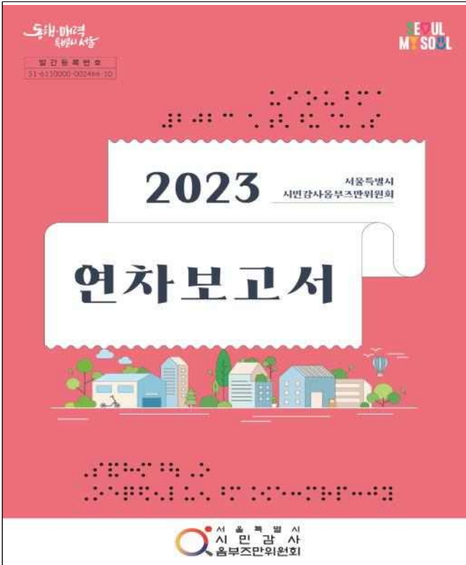
인쇄물(연차보고서 표지에 점자 표기)