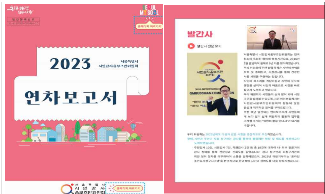
전자책 (홈페이지 바로가기)