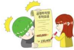
인쇄물(내용 이해도를 높이기 위한 삽화 삽입)

서울시 공영주차장의 월 정기권을 매월 구매하여 이용 중이던 민원인은 다음 달 정기권을 구매한 줄 알고 며칠 동안 주차장을 이용하던 중 주차장 현장근무자가 문자로 월 정기권 만료 사실을 안내하여 당일 월 정기권 잔여분을 구매하였으나, 잔여분 이전 기간의 주차 요금이 시간제 요금으로 부과된 바, 이는 선량한 관리자의 주의 의무를 다하지 않은 것이므로 이에 대한 부당함을 공단 등에 호소하며 납부를 지연하였으며, 공단의 납부 고지서 발급, 민원인의 이의 신청 등 민원 제기, 독촉 고지서 발급과 압류 조치가 이뤄지자 민원인은 공익제보 등을 하였으나 받아들여지지 않았으며, 위원회 조사 및 검토 결과에 따라 민원인의 동의를 얻어 민원배심제를 실시하게 되었습니다. 민원배심 결과, 민원인에게 부과한 월정기권 만료 이후 발생한 시간제 주차요금을 50% 감액하여 징수할 것을 '권고'하고, 서울시는 노외주차장 운영과 관련하여 '1일 주차요금 상한제'의 도입과 '월 정기주차 종료 전 안내 고지' 등 필요한 제도 개선 사항을 검토하고 이에 따른 조례 개정 등을 조치할 것을 '의견표명'하였습니다.