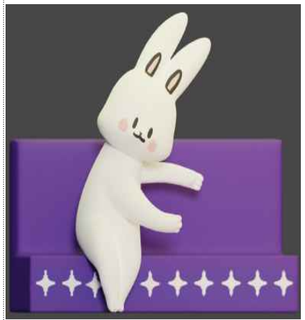
<소형 조형물, 외부조명>