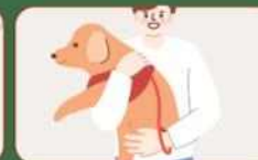
실내 공용공간에서 반려견의 이동 제한 반려동물을 직접 안거나, 목줄의 워딩이 부분 잡기 등