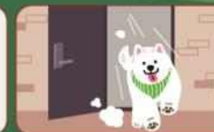
소유자 등 없이 기르는 곳 벗어나지 않게 하기