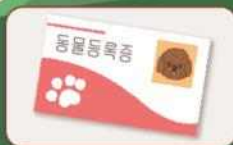
반려견은 반드시 동물등록