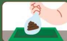
배설물 즉시 수거