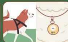
목줄 및 인식표 하기 길이 2미터 이내 명견은 가슴줄 불가