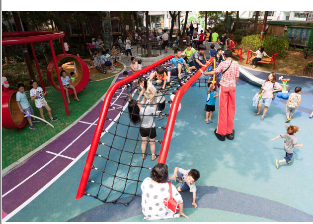
'16년 강동구 달님어린이놀이터