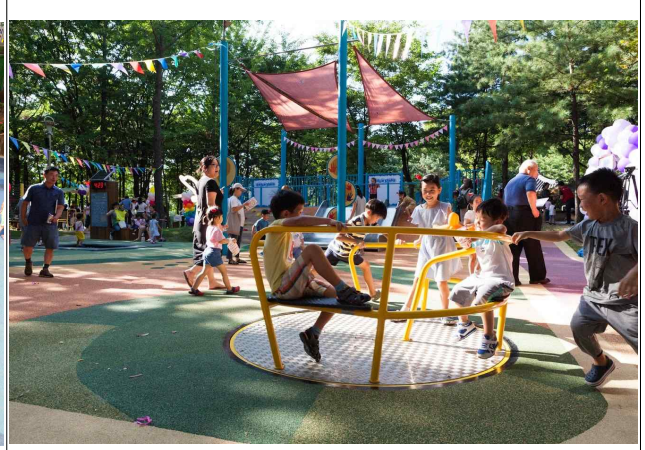
'18년 노원구 마들체육공원