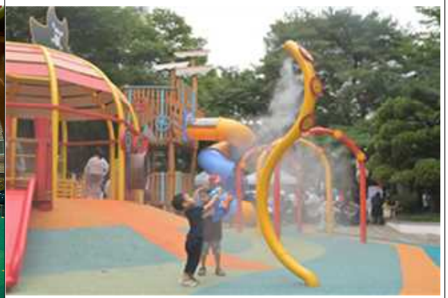
'23년 중구 목정어린이놀이터