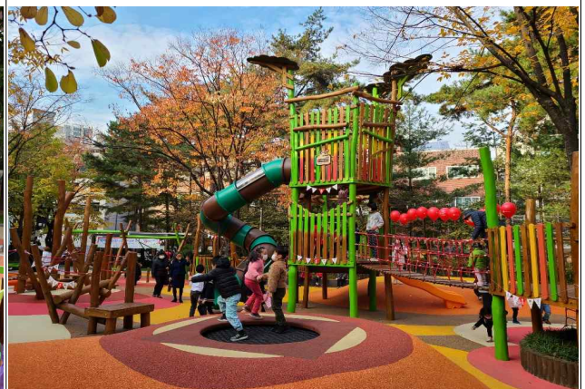
'20년 성동구 도선어린이놀이터