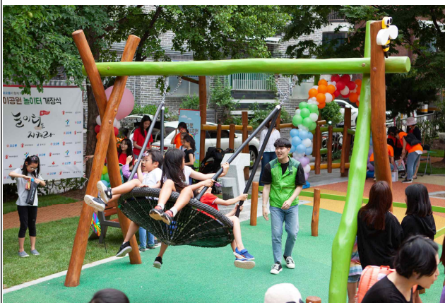
'19년 강서구 다운어린이놀이터