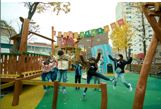
'21년 은평구 새록어린이놀이터