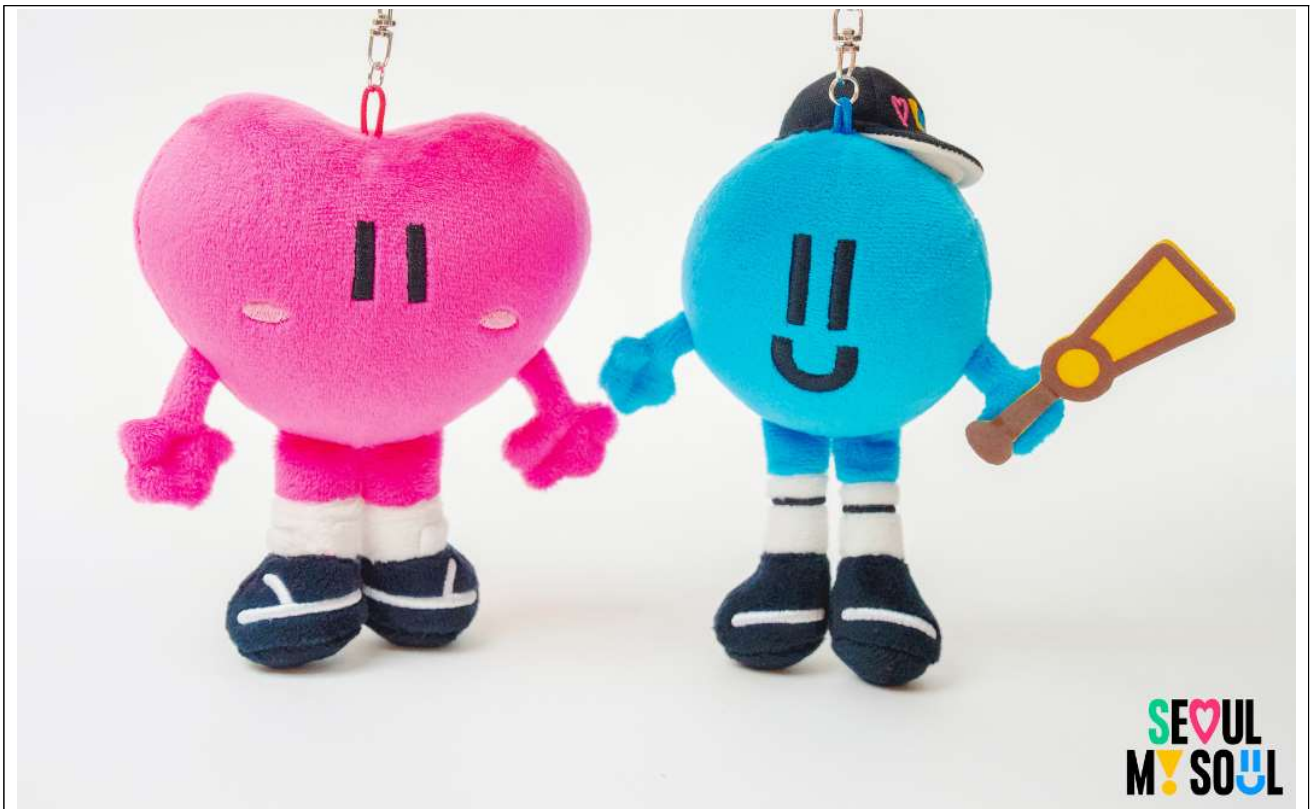
동행이 매력이 열쇠고리