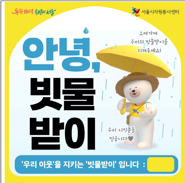
〈안녕, 빗물받이〉 캠페인 활동 부착 스티커