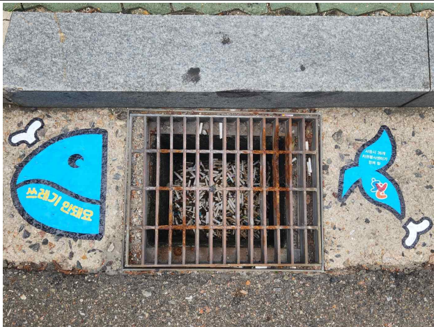
〈빗물받이 '찾고 바꾸고' 시민실천 공동행동〉 쓰레기 투기 방지 활동 - 스티커 -