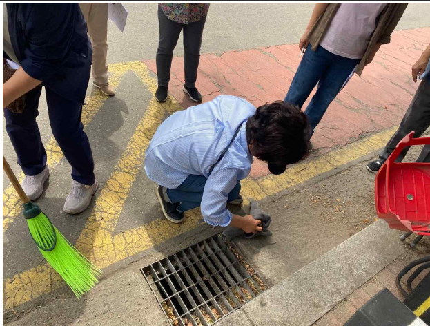
〈빗물받이 '찾고 바꾸고' 시민실천 공동행동〉 오염원 정화 활동