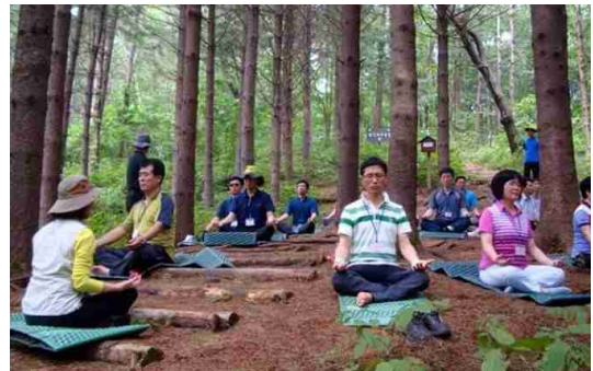
숲체험 프로그램 운영 등