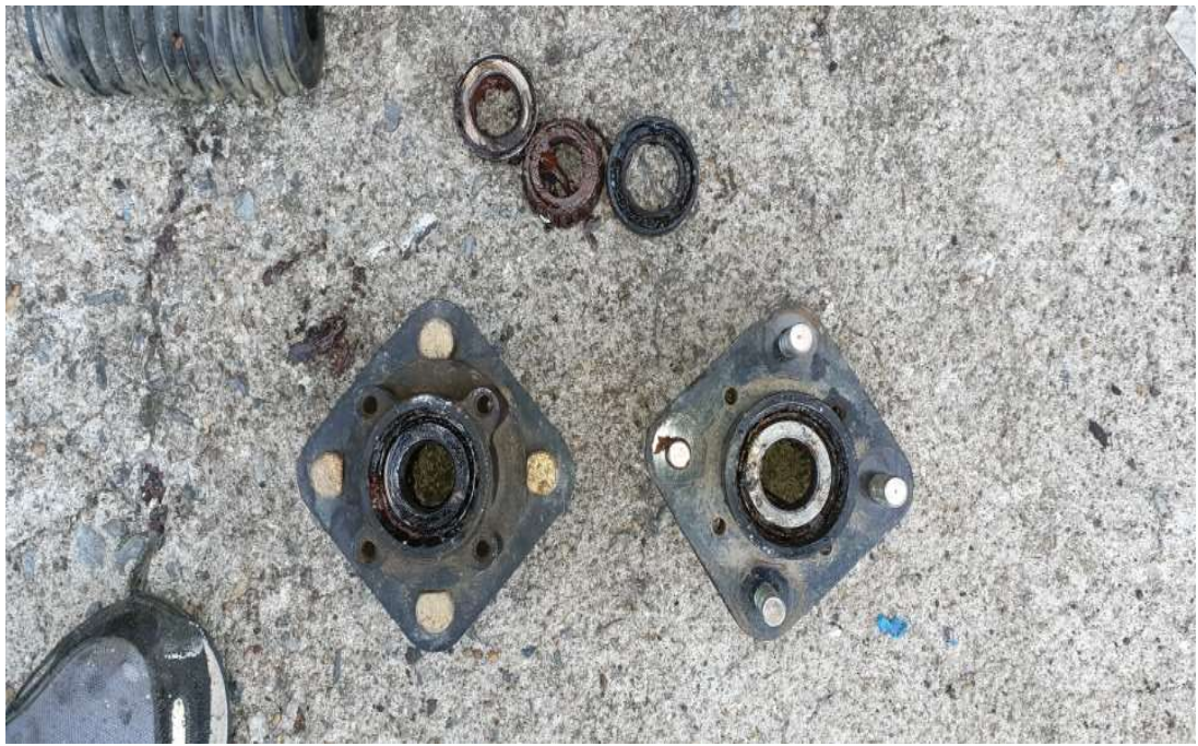
허브베어링 교체 전