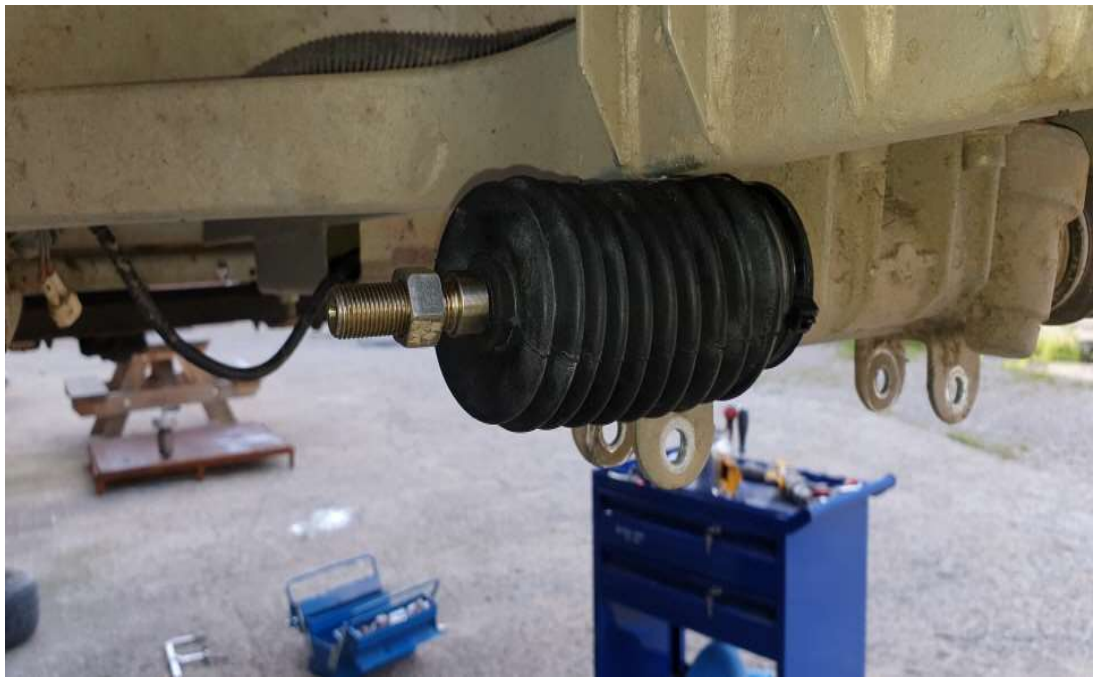
스티어링 고무 교체 후