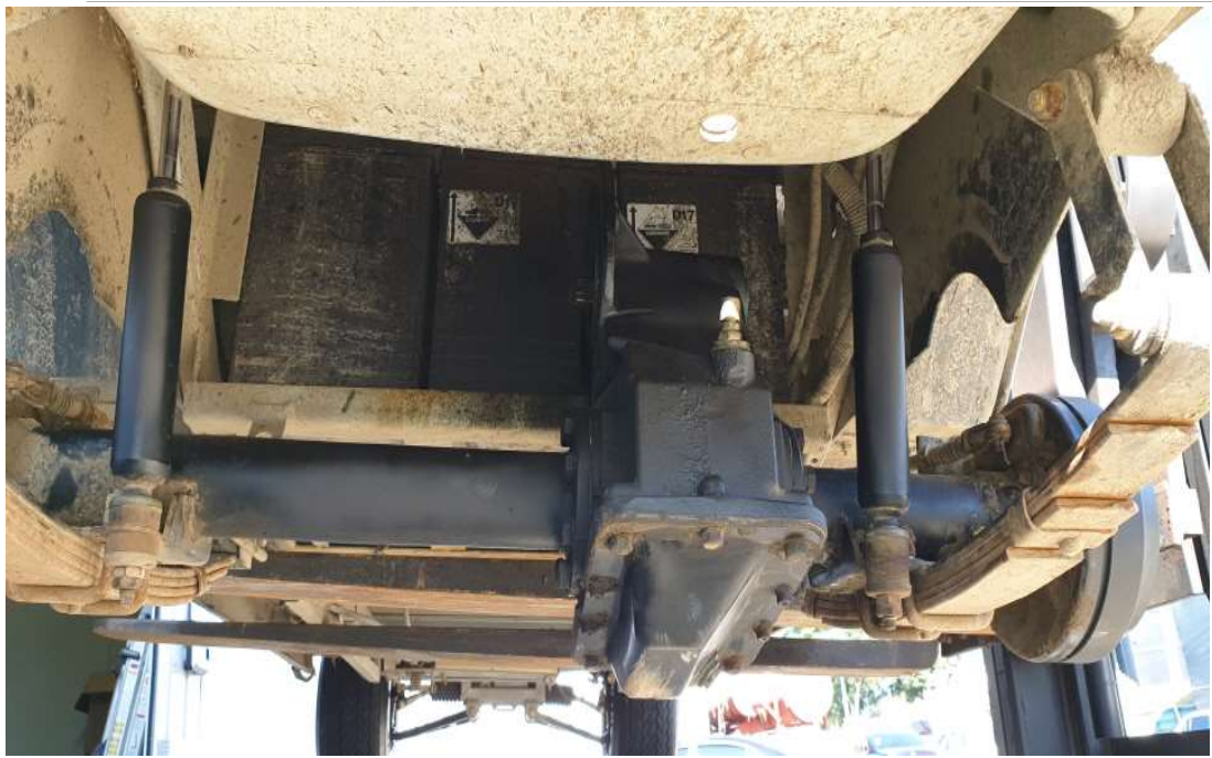
기어오일 누유 수리 후