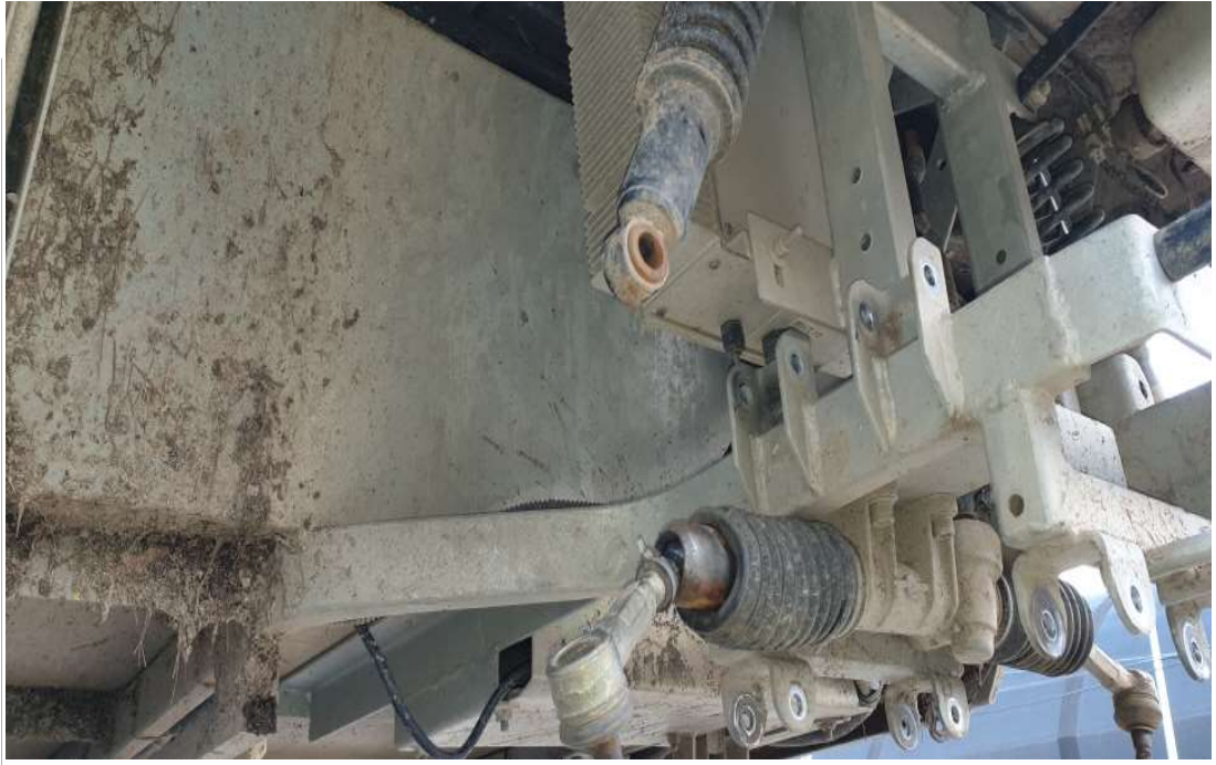
타이로드 조인트, 엔드 조수석 교체 전