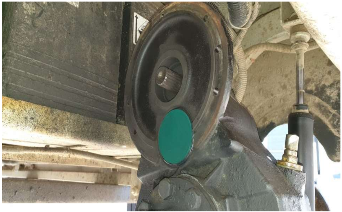
디퍼런셜 씰링 작업후