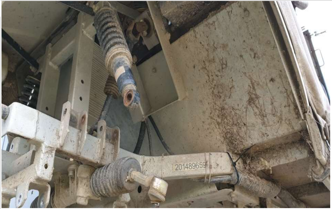
타이로드 엔드 운전석 교체 전