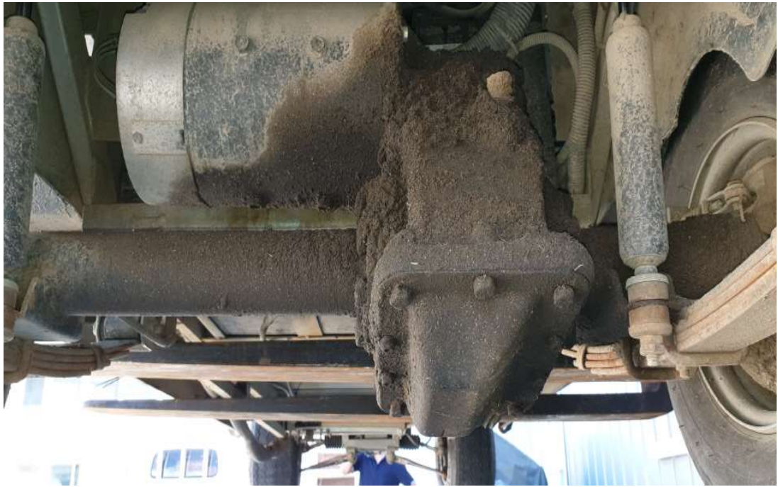
기어오일 누유 수리 전