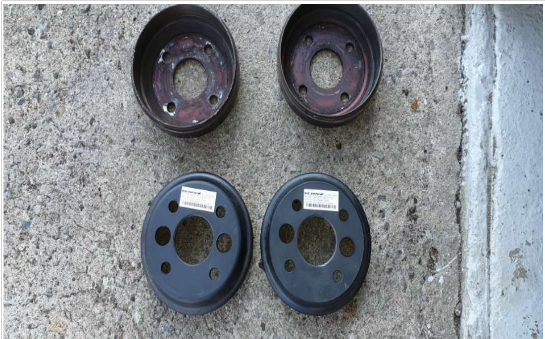
브레이크 드럼 새제품