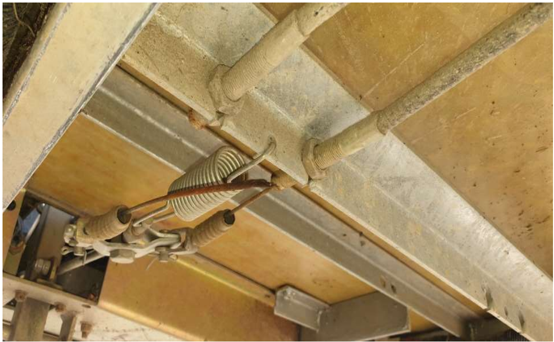
브레이크 케이블 수리 전