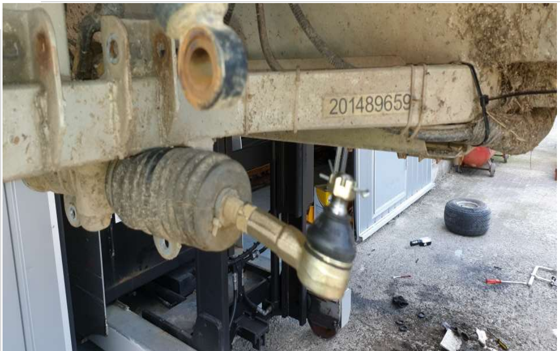
타이로드 엔드 운전석 교체 후