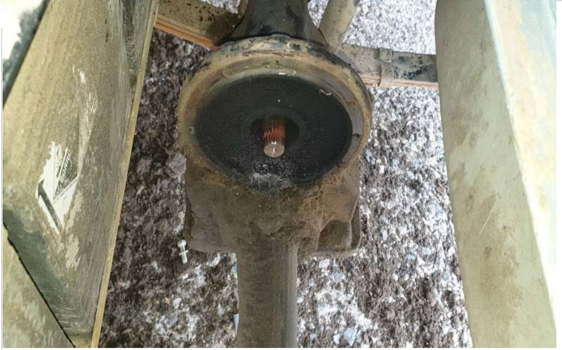
디퍼런셜 씰링 작업전