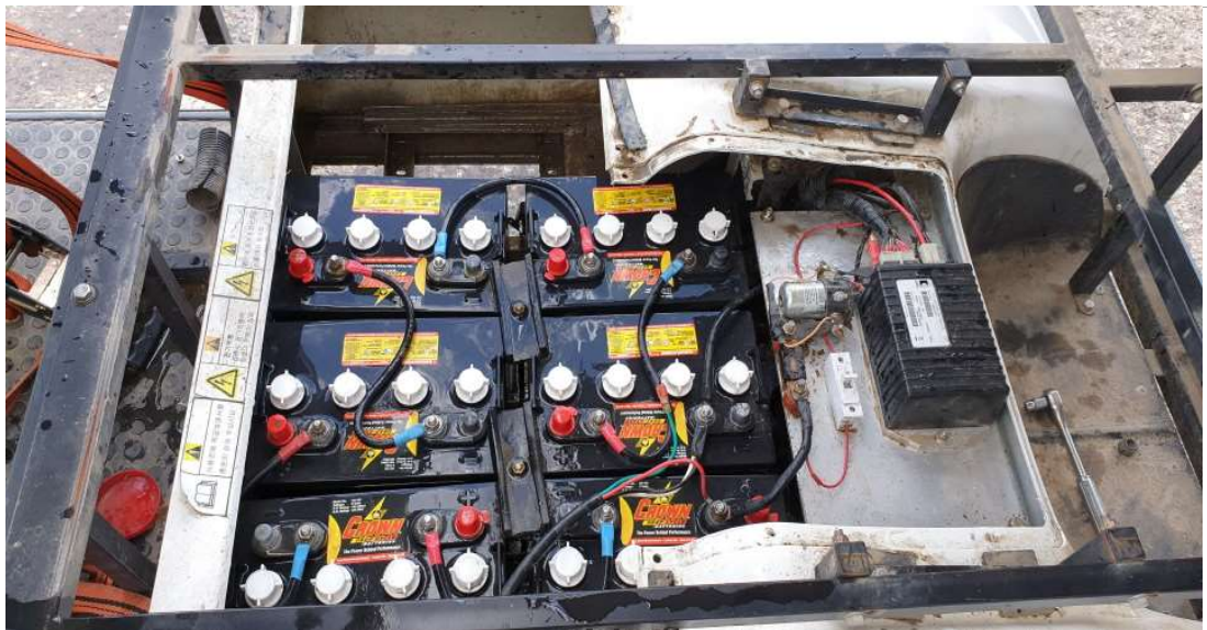
배터리 청소 후