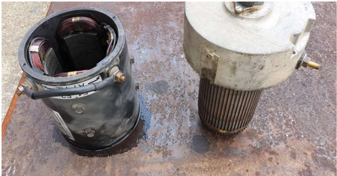
모터 청소 후