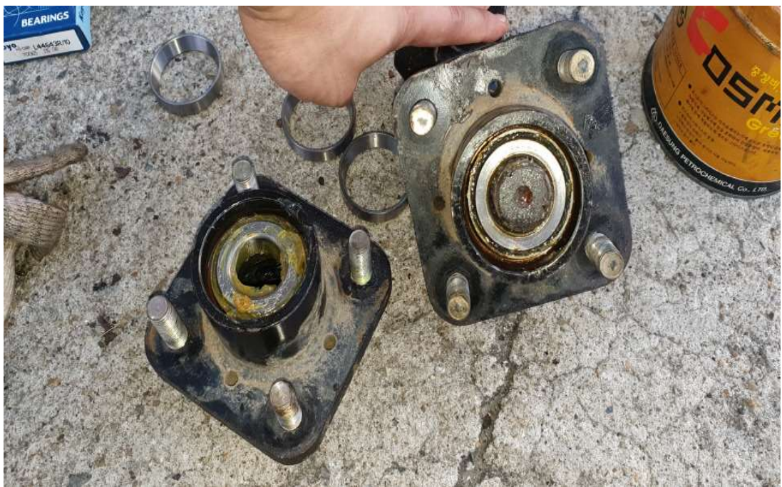
허브베어링 교체 후