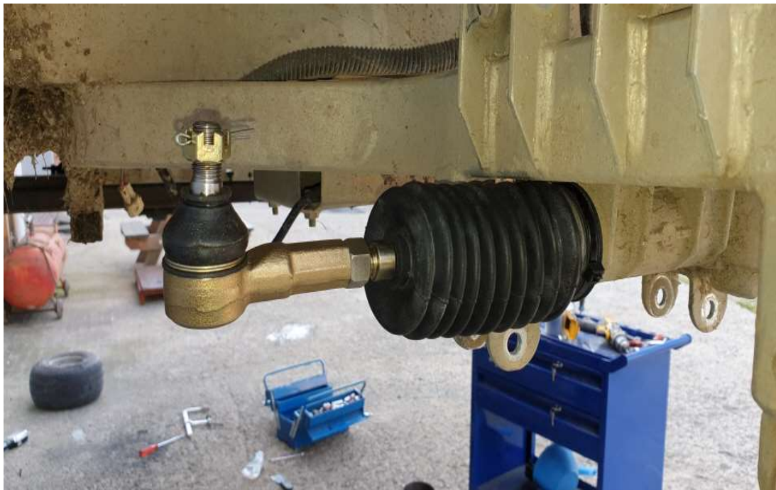
타이로드 조인트, 엔드 조수석 교체 후