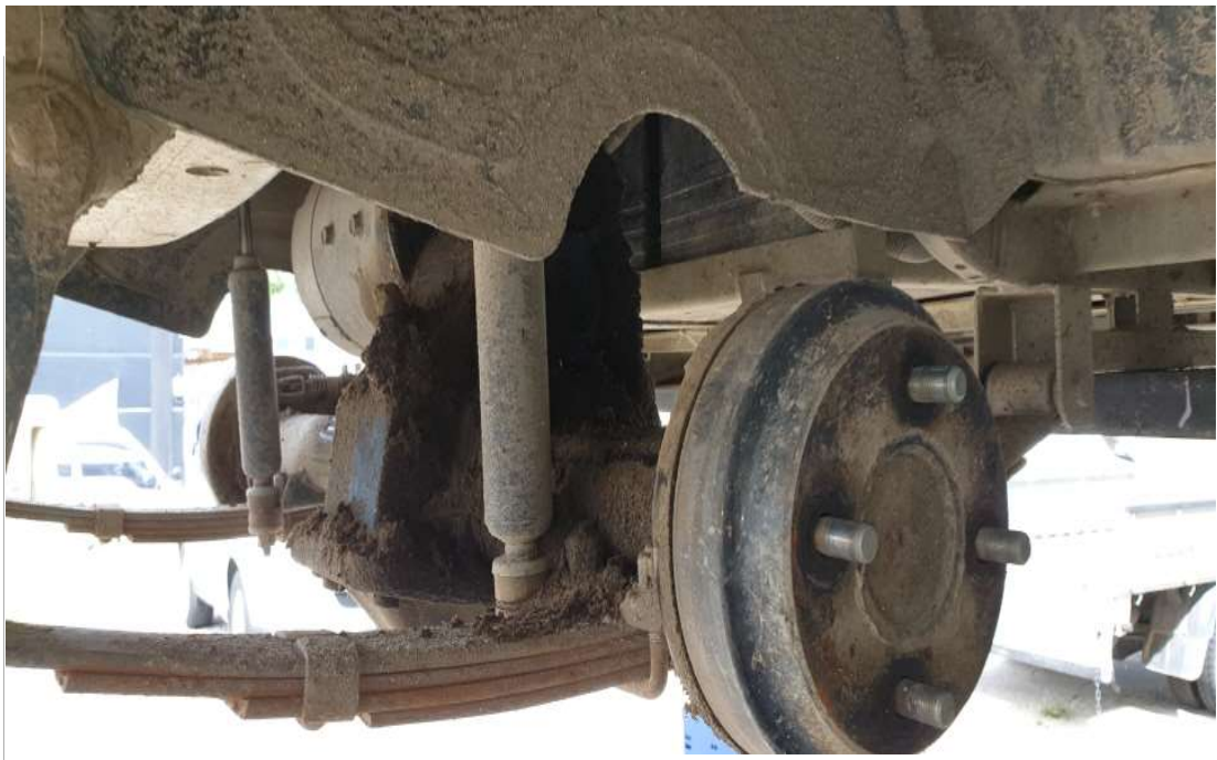
브레이크 교환 전