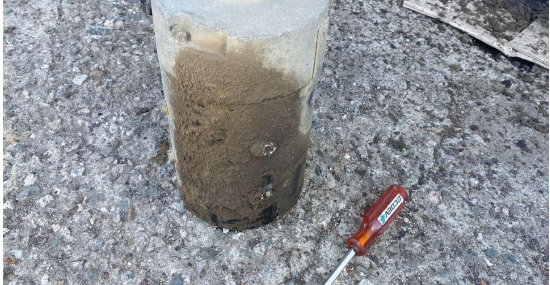
모터 청소 전