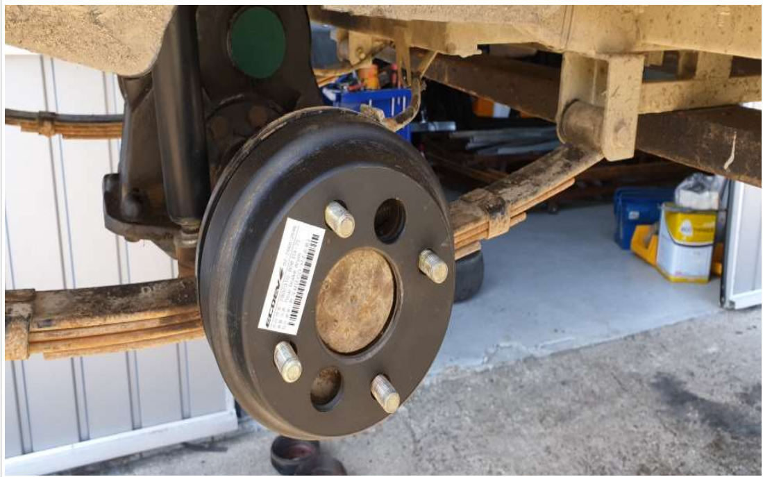
브레이크 드럼 교환 후(조수석)