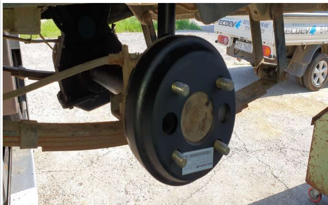
브레이크 드럼 교환 후(운전석)