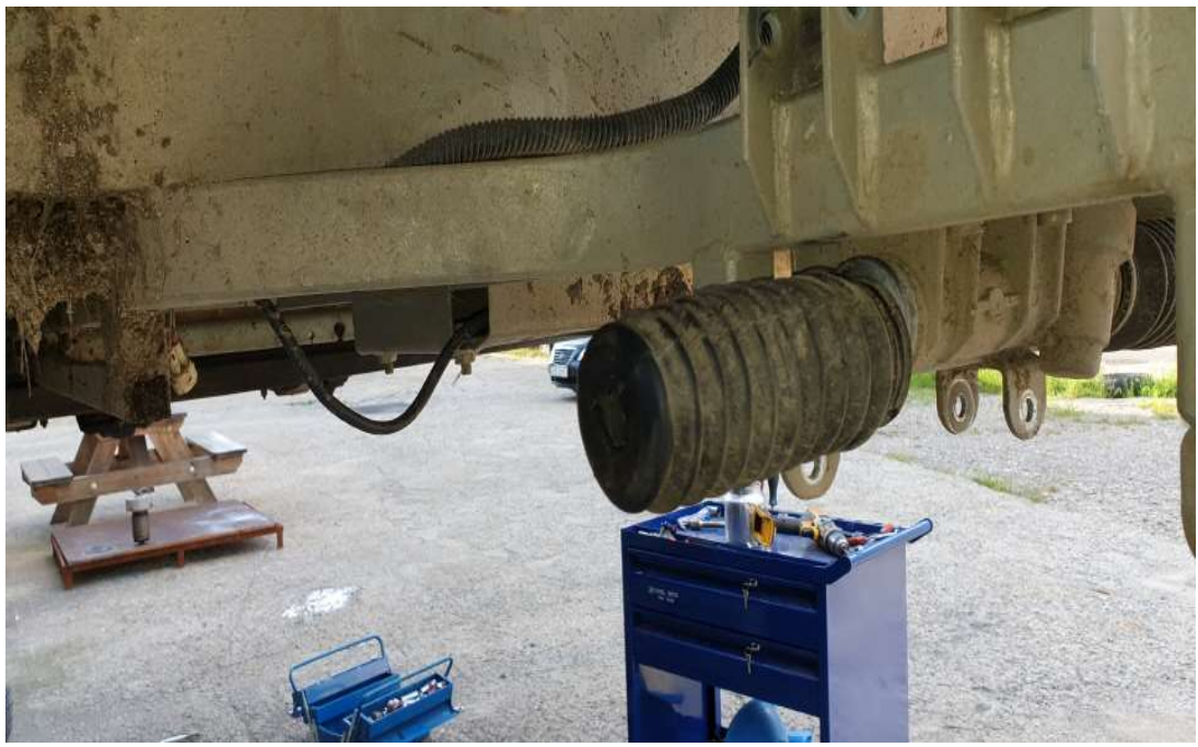
스티어링 고무 교체 전