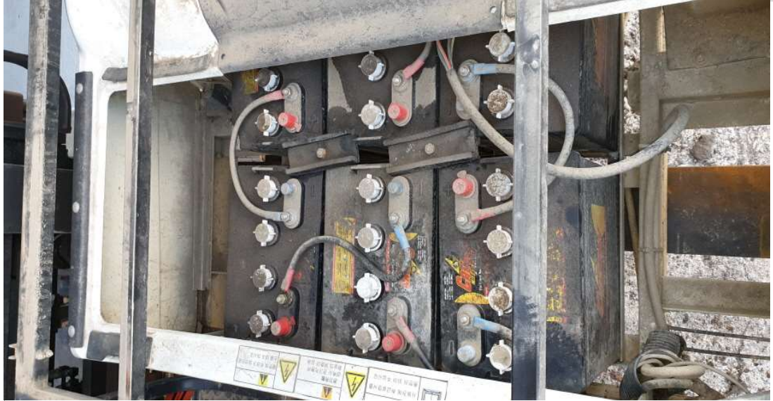
배터리 청소 전