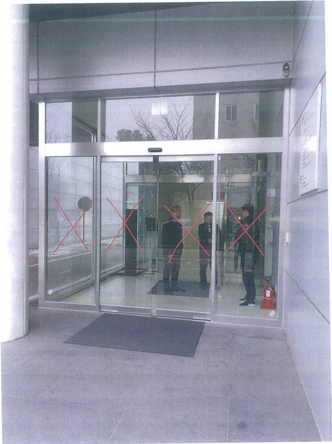
<자동문 설치 완료 >