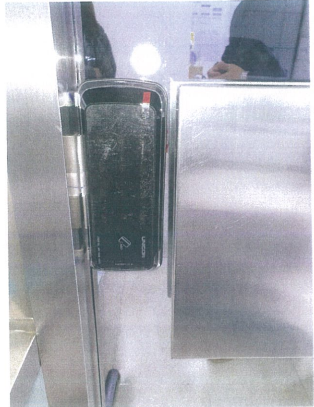
< 자동문 열쇠 및 번호키 설치과정 >