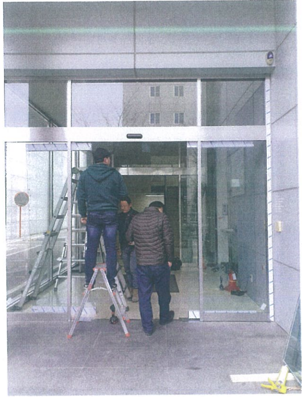
< 자동문 픽스유리및 자동문설치과정 >