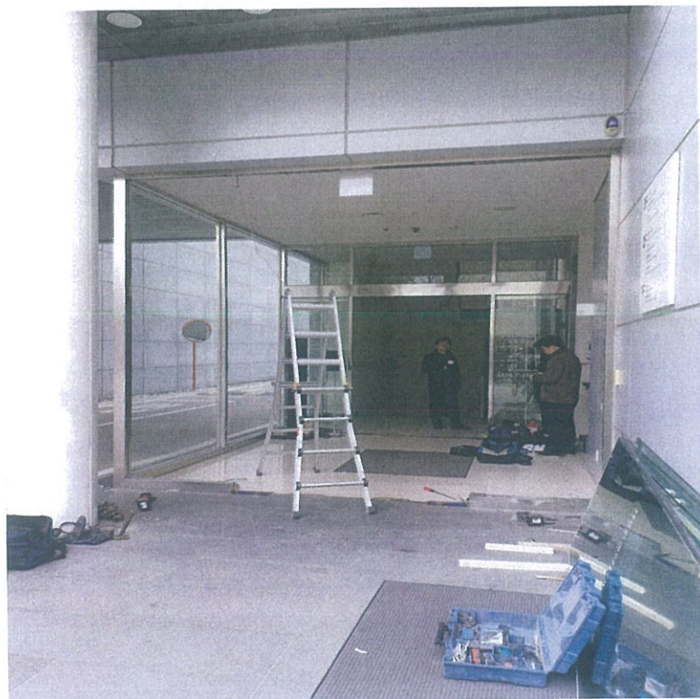
< 기존 강화도어 유리문 철거 및 프레임작업 >