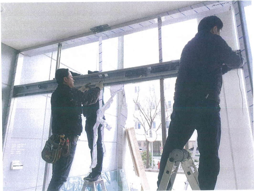
<자동문 작동기 및 소방개폐장치 설치과정>