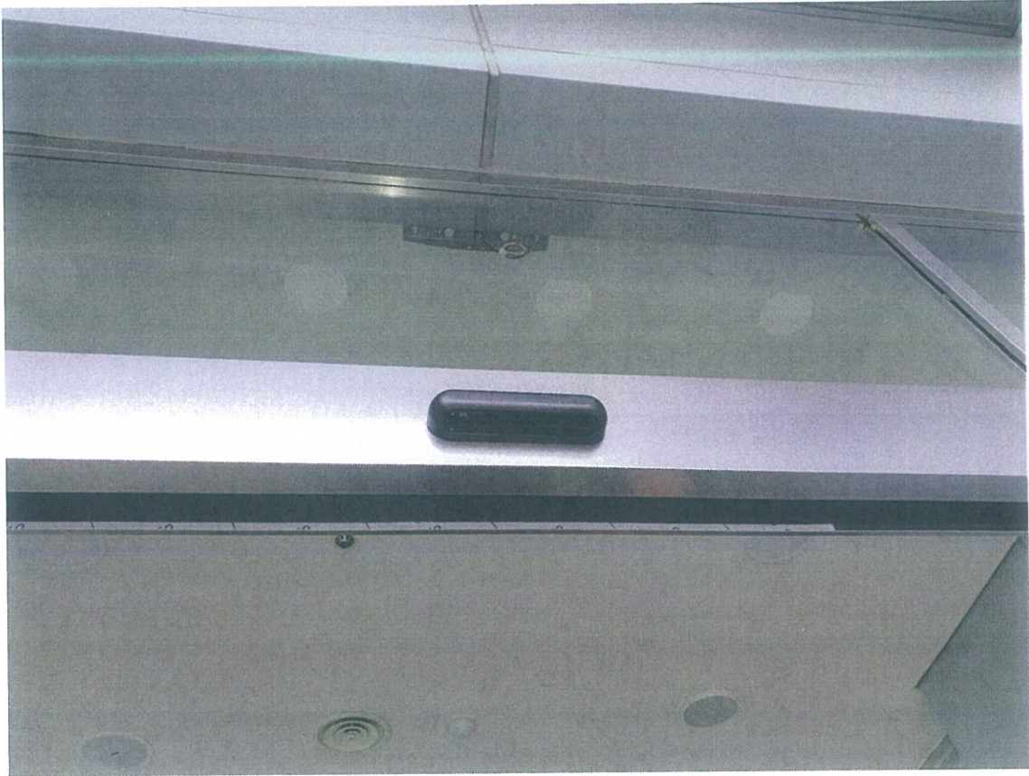
< 고급형 내,외부 센서 장착 >