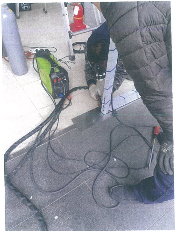
< 전기작업 및 용접작업 과정 >