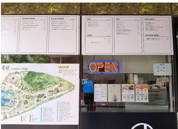
판매물품 가격표시 여부