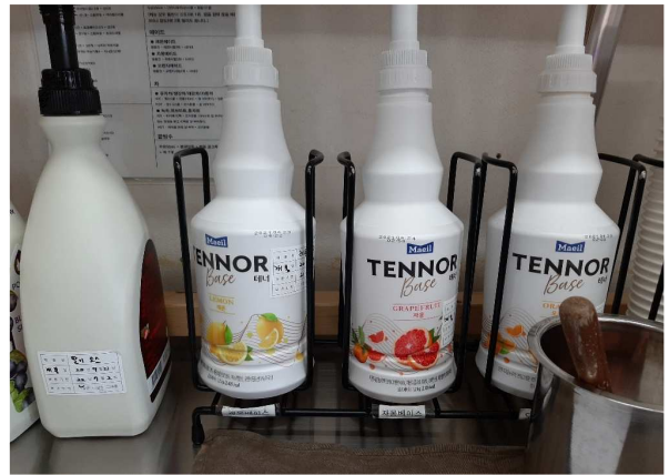
유제품 등 유통기한