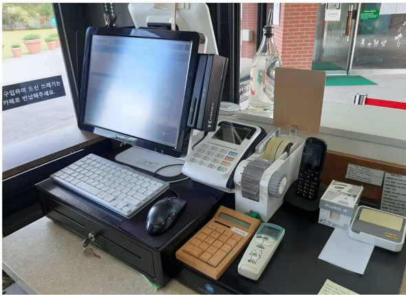
신용카드 등 계산기